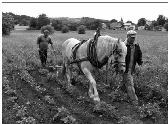
Prikaz oranja s konji (foto: Stojan Spetič).

Prehrana Pivčanov je bila sprva sestavljena predvsem iz krompirja in (prosene) kaše, vendar je sredi 19. stoletja zaradi mokrih let krompir gnil, pa tudi proso se je kvarilo. Zato so ljudje v prehrano uvajali fižol in koruzo, ki so jo sprva kupovali v Trstu. Tako so Pivčani trikrat dnevno jedli močnik in žgance na osnovi koruze, 51 na jedilniku pa so imeli tudi fižol