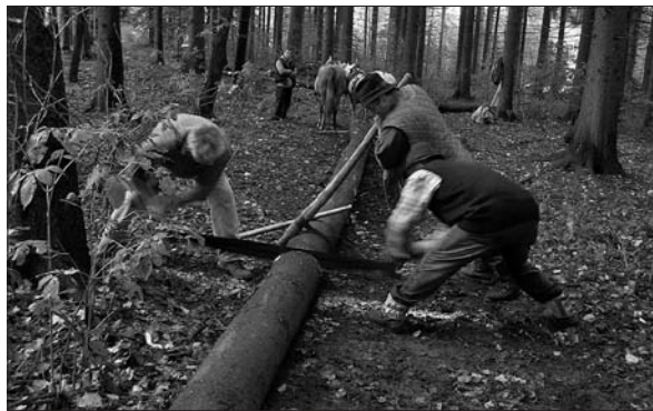
Prikaz dela v gozdu v nekdanjih časih.

in na Turško so se prebili. 32 Tam so služili z drvarjenjem, pripravljanjem drv za kurjavo in izdelovanjem dog za sode. Nekateri so ob povratku okoli velike noči ali jurjevega (23. ali 24. aprila) prinesli domov po 100 do 200 goldinarjev, bolj zapravljivi, manj pridni ali opeharjeni od kupcev pa so se vračali praznih rok. 33 Tovrstno odhajanje na začasno delo v tujino je bilo značilno prav za območje Zgornje Pivke in Bistrice. Poleg denarja so hrvatariji , kot so jim rekli, domov prinašali tudi slabe stvari: opuščanje verskega življenja, kletvice, zapravljanje, pijančevanje, bolezni in smrt. 34