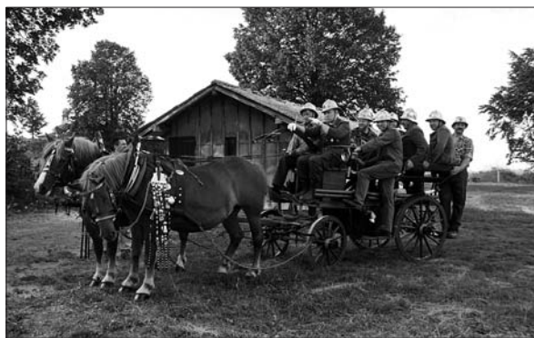
Gasilci iz Knežaka so pokazali, na kakšen način so včasih pomagali.

Ko govorimo o društvih, velja opozoriti na danes najbolj razširjeno prostovoljno dejavnost v Sloveniji – gasilstvo. Veliko težavo je človeku 19. stoletja predstavljal ogenj. Na novo leto 1849 je Bač skoraj v celoti pogorel: ostalo je le 16 od 81 hiš. Ogenj se je zelo hitro razširil tudi zaradi burje. Tako je več kot 500 ljudi ostalo brez hrane in slamnate strehe nad glavo, pa tudi tisti, ki so bili zavarovani, niso bili zavarovani za toliko, kolikor so izgubili. 76 Ob nesrečah z ognjem se v časopisu pojavljajo pozivi k zavarovanju premoženja pri zavarovalnicah, ki so takrat že delovale. Gasilska društva so precej mlajša od zavarovalnic: najstarejše gasilsko društvo na Slovenskem