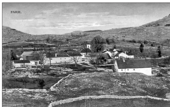
Golo kraško površje v okolici vasi Parje. Razglednica iz tiskarne Šeber, Postojna, ok. 1900.

Mirolavu Vilharju je oče graščino in posestvo na Kalcu prepustil leta 1843. Postal je zemljiški gospod na Kalcu, novoveškem gradu 19 v bližini izvira reke Pivke, ki daje ime tudi pokrajini okrog sebe. Janez Bilc (1839–1906), duhovnik, pesnik in dopisnik v slovensko časopisje, Vilharjev sodobnik in prijatelj, po rodu iz bližnje Ilirske Bistrice, je Pivko dobro poznal. 20 V Kmetijskih in rokodelskih novicah je poleti 1856 izhajal njegov »Popis bistriške doline na Notranjskem«, v katerem slikovito opisuje, kakšna je bila videti Zgornja Pivka sredi 19. stoletja: »Res žalostno je potovati po terdem Krasu. Kamor se človek ozre, malo drugega vidi ko kamenje. Travniki, hribi in doline, vse je s kamenjem obsejano. Tu se ti dviguje mogočna skala