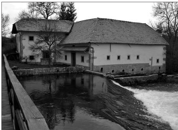
Obnovljeni Čadežev mlin pri Žejah.

V zimskem času, ko sta na Pivki kraljevala sneg in burja, so si iznajdljivi Pivčani našli delo v toplejših krajih. Se danes ve marsikateri domačin povedati, da so v starih časih na zimo hodili na delo v gozdove na Hrvaško. Okoli sv. Mihaela (29. septembra) ali kak mesec kasneje, za sv. Luka (18. oktobra), so možje in fantje od doma odhajali s trebuhom za krvavo zasluženim kruhom v Slavonijo in na Ogrsko, v Romunijo, Galicijo in Sedmograško, celo do Črnega morja