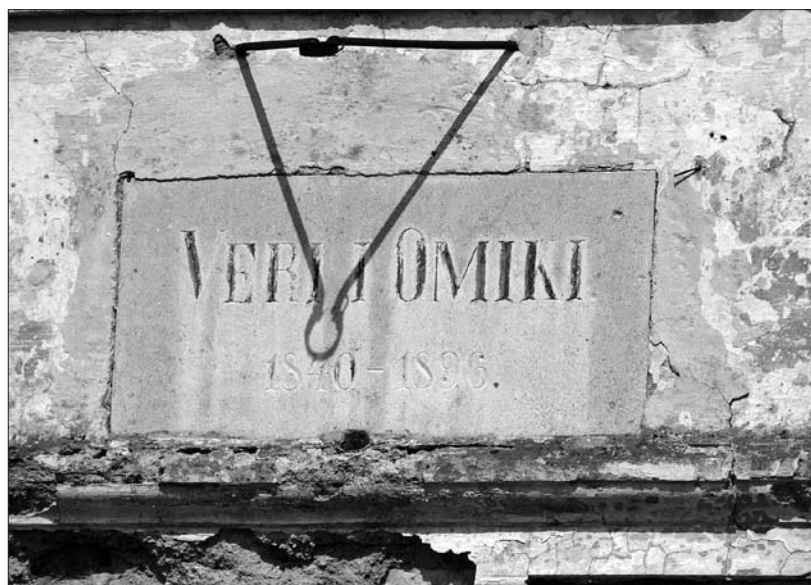
Najstarejša šola na Zgornji Pivki stoji v Zagorju. Napis nad njenimi vrati priča o namenu stavbe (foto: Tatjana Lutar).

klice so pomagale v kuhinji. Spomladi so fantje gnali govedo na pašo, kjer pa so se v glavnem igrali. Ko so postali lačni, je iz torbe vsak vzel svoj kos kruha, za žejo pa so si v izdolben hlebček kruha namolzli mleka. Zvečer, ko so se vračali s paše, so veselo zapeli, doma povečerjali in zaspali v senu. Poleti so pasli ponoči; ob živini so skupaj bedeli, dokler niso oni in živina zaspali. Vedno pa je ostal eden na straži, od pol do cele ure. Stalna nevarnost so bili namreč volkovi, ki so jih znali fantiči prepoditi z ognjem in kričanjem. 63