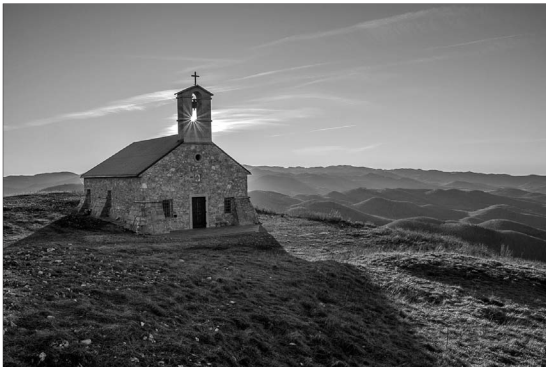
Jutranji pogled na snežniško pogorje s Svete Trojice (1106 m).

Ko pride popotnik na Pivko, 1 se mu izriše podoba gozdnatih gričev, ki objemajo Pivško kotlino. Z ene strani ob zgornjem toku reke Pivke kotlino varuje Sveta Trojica, z druge pa skoraj pragozdnato zaraščena Osojnica. Vmes so posejane vasice s cerkvami. Na eni strani je Snežnik in na drugi Nanos. »Podoba raja«, se utegne utrniti misel. Kak Pivčan vam bo oporekal: »Kaj tukaj vidiš takega? Pri nas rasteta samo krompir in zelje, pozimi je sneg in mraz ...«