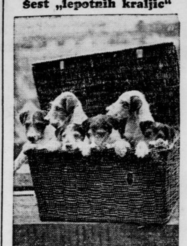
Odklikovalci na londonski razstavi foksterierjev