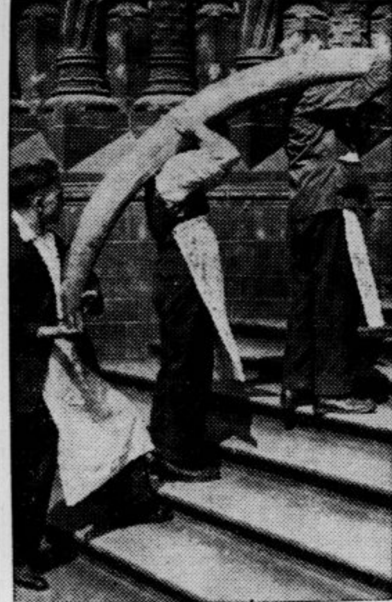
Britski muzej v Londonu si je nabavil velikianski okel, čigar prenos je vzbudil v mestu veliko pozornost

Ljubitelji lokvanja ( Nymphaea alba ) opozarjajo na jarek na levi strani Ljubljaniče malo niže mesta, kjer se Borovniška snide z Ljubljaničo. Za časa poplavlja se napolni ta jarek, ki ga imenujemo Staro Ljubljaničo, z vodo. Tam, kjer menja smer proti vodu je pokrit nekih 300 korakov z okroglimi, ploščatimi, deloma rdečimi listi in s snežnobelimi cveti lokvanja. V tem jarku so tudi rmanec, neka vrsta ludvigije, slohar in druge vodne rastline, ki se v črni zemlji tega jarka posebno lepo razvijajo. Poleg pupkov, hroščev in vsakovrstnih žuželk je tudi mnogo polzev poštarjev in mlakarjev, ki služijo tamošnjim činkljam za hrano. Beli lokvanji so tudi v treh bajerjih pri vasi Bistri, kjer izvira na vznožju Ljubljanskega vrha zelenomodra, hitra Bistra. Akvaristom in ljubiteljem vodnih živalic in rastlin, ki imajo kolesa, se izleti v daljšo okolico izplačajo, zlasti k vodam v smeri proti Vrhniki in Krimu, kjer sta vodna favna in flora najštevilneje zastopani. Posebno mnogo nudi akvaristom borovniško-vrhnjska kotlina s svojimi jarki, potoki in bajerji. O. S.