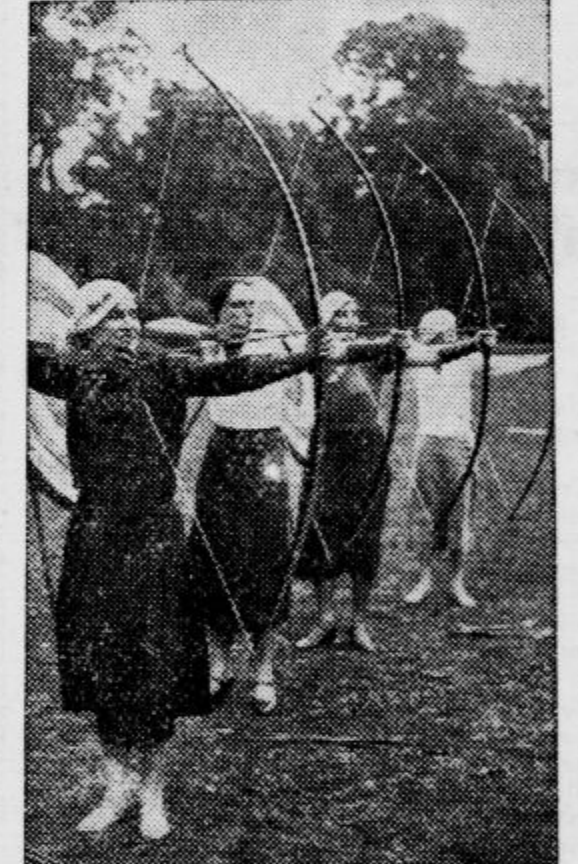
V Ranelaghu (na Angleškem) se je pričela mednarodna tekma v lokostrelstvu