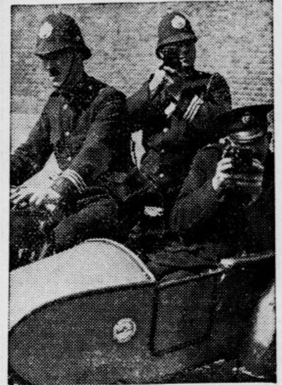
Del londonske policije je opremljen s foto-frafskimi kamerami za posnetek dejanskega stanja na licu mesta