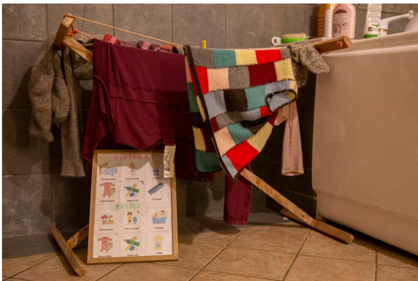
Slika 3: Majhno obešalo za perilo za najmlajšo hčerko v kopalnici. Pod njim je uokvirjena tudi jutranja in večerna rutina z risbami in napisi: »pospravim posteljo/igrače, grem na stranišče, se oblečem, pospravim/si oblečem pižamo, umijem zobe, se počešem, molitev«, ki pri otrocih spodbuja samostojnost in samoiniciativnost.

veganska ali lokalna hrana). Razdelki na jedilniku lahko zajemajo tudi nakupovalni načrt in nove ideje za kuhanje. Takšni jedilniki jim ob predhodni pripravi omogočajo, da ne kuhajo zadnjo minuto tekom dneva, ko imajo še druge obveznosti, ali pa da lahko naredijo kaj v tišini brez prisotnosti otrok. V tovrstni skrbi za prehranjevanje z doma pripravljeno hrano za vse družinske člane (tudi zaposlene partnerje) so si sogovornice poiskale strategije oz. načine, ki jim pomagajo kuhanje in pripravo hrane vključiti v proces izobraževanja otrok (učenje v praksi) ali specifične načine priprave hrane, kot pove sogovornica A.