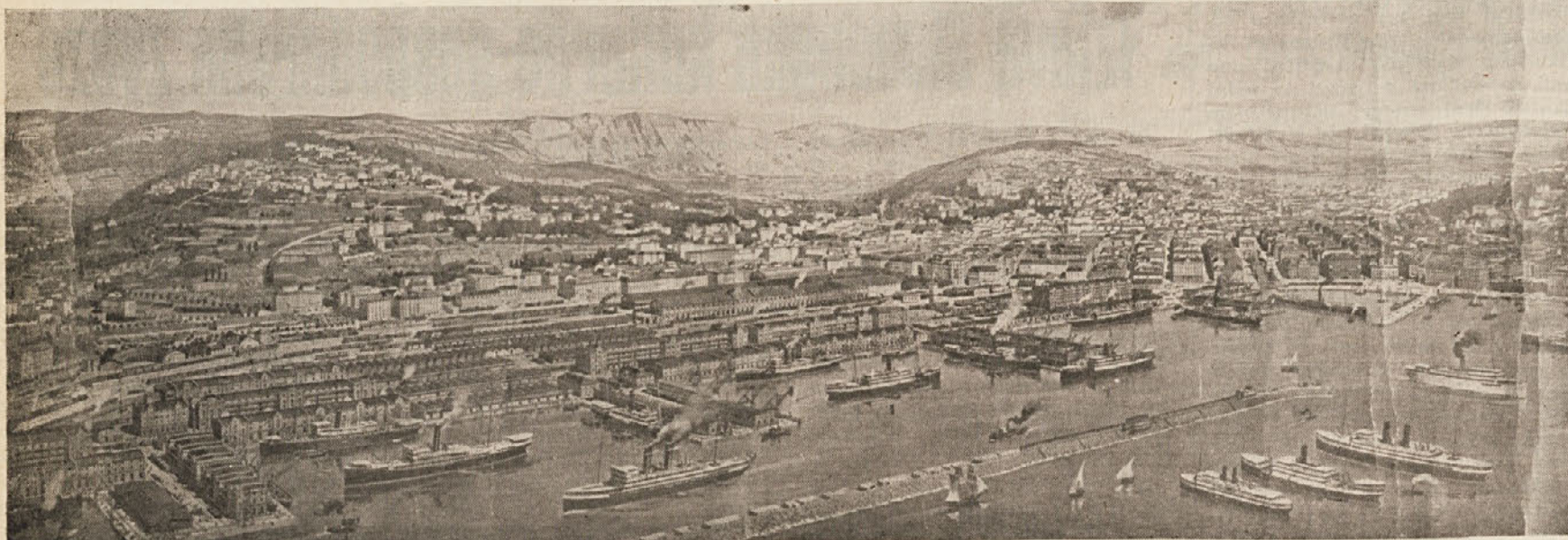
Tržaško pristanišče nekoč (spodnja slika) in danes (zgornja slika)

Podpirala bo pobude za razvoj turizma in športa.