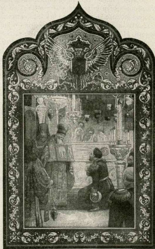
Kuropatkin v Sergijevi lavri.