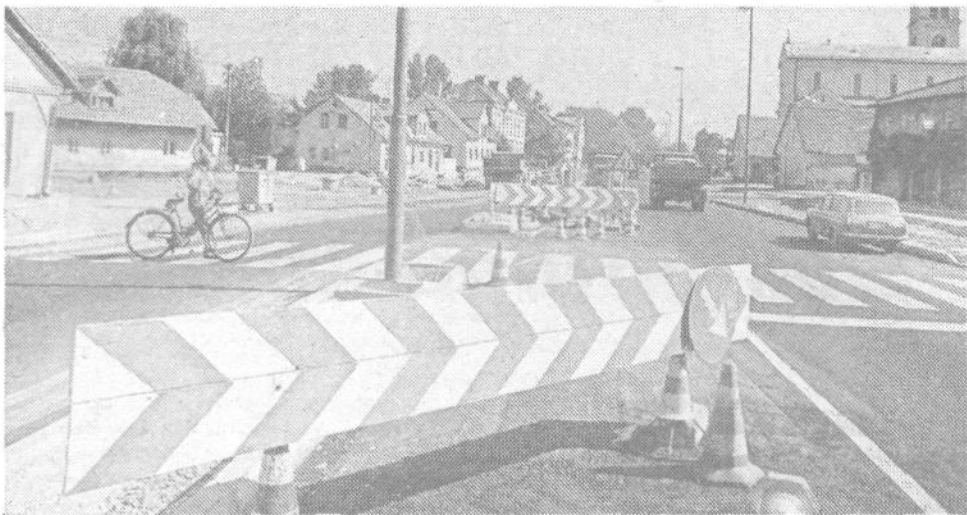
Vreme »pomaga« cestarjem in tako je pričakovati, da bo do 10. oktobra stekel promet po delu od za letos predvidenega programa izgradnje Tržaška ceste. Zatika se žal pri hiši 101, kjer lastnik ni pristal na pogoje odkupa.