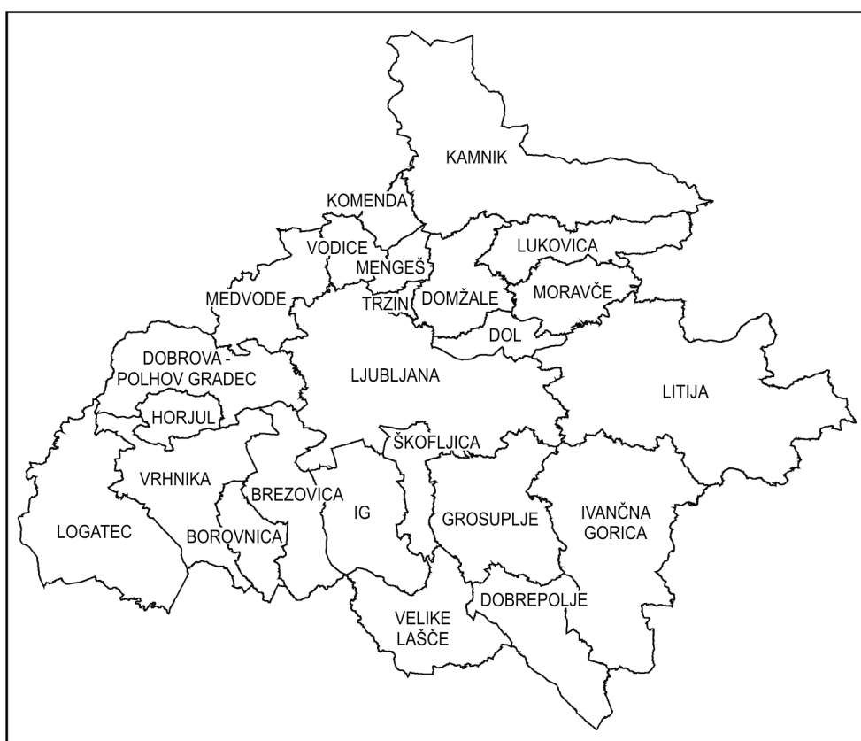
Slika 1: Ljubljanska urbana regija – upravna delitev na občine

Današnje število in prostorska razporeditev prebivalstva v Ljubljanski urbani regiji je predvsem rezultat migracijskih gibanj, ki so potekala v Sloveniji in tudi nekdanji Jugoslaviji po letu 1945. Čeprav je za Slovenijo še danes značilna relativno nizka stopnja urbanizacije, ki dosega le nekaj čez 50 % prebivalstva, pa je za prvo povojno obdobje do