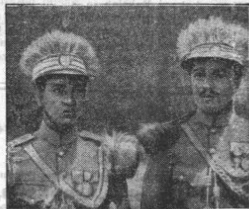
Dva mična abesinska častnika v paradni uniformi

Poveljstvo nad abesinsko vojsko v provinci Dessie je poveril abesinski cesar svojemu najstarejšemu sinu prestolonasledniku Defeu. Na sliki ga vidimo z mlajšim bratom, ki je vojvoda Harrarski.