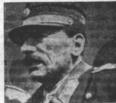
Grški vojni minister Kondilis, ki je sestavil novo monarhistično vlado v Grčiji in ki nadomestuje v državi do povratka grškega kralja Jurija

Ta se namreč sestane 20. t. m. Za zdaj so vse domneve pač res le ugibanje, ker je težko