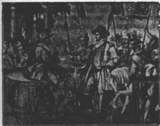
Knežji stol s prizorom ustoličenja

pozabili, toda naj tudi nikar ne odloča o našem sedanjem zadržanju. Pripravljeni smo mirno živeti z vsemi sosedi Avstrije brez izjeme, z njimi pametno sodelovati, da tako pomagamo Evropo ozdraviti in mir rešiti. Pravičnost mi narekuje, da se pri tej priložnosti spomnim tudi tistih, ki so pred 15 leti, čeravno govorijo slovensko kot svoj materni jezik, pri glasovanju s svojimi glasovi dokazali svojo zvestobo do Avstrije in v prvi vrsti doprinesli, da tako velik del Koroške ni prišel pod tujo državo, marveč je ostal ohranjen Avstriji. Tej slovenski narodni manjšini velja največja skrb ne samo od strani koroške dežele, marveč tudi od zvezne avstrijske