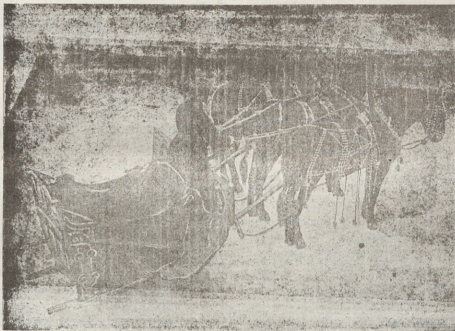
Vožnja na saneh v Rusiji.

Bolnemu otroku je treba vse dovoliti, vse ponuditi in ničesar odreči. Tako si je mislila neprevidna mati v svoji slepi ljubezni do otroka Marička je postajala vsak dan brihtnejša. Kadar se ji ni ljubilo v šolo, je tekla k materi »oh, oh,