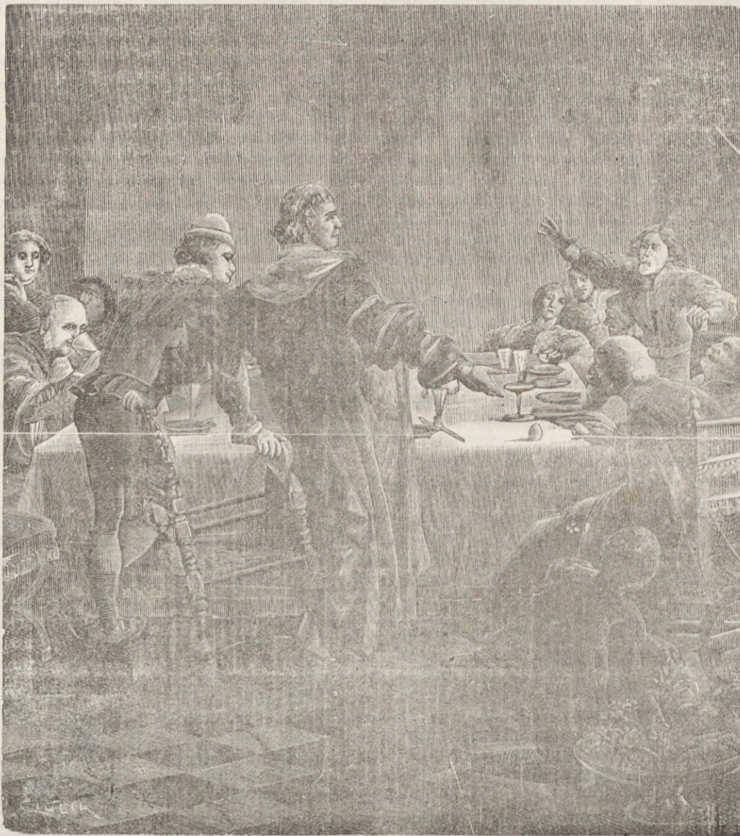
(Iz življenja Kristofa Kolumba.)

Po razsežnosti bi imela Kitajska v ožjem pomenu kake štiri milijone štirjaških kilometrov. Severna polovica je nižavje, južna bolj gričasta a brez posebno visokih gora. Zato je ona tudi bolj rodovitna ko ta. Namakata jo dve veliki reki