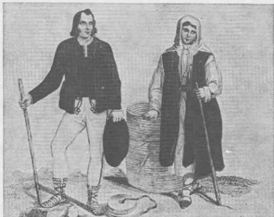
Značilna »bala« leskovih obročev »koreteljev« za lesene posode, Prem na Notranjskem, Carniola 1844

Podlaga za številne lesne obrti so seveda širni gozdovi s primernim lesom. Prevladujejo črni gozdovi s smreko in jelko. Izmed listavcev je najbolj razširjena bukev, javor pa so že precej iztrebili. Zato ga uvažajo od drugod. Javor potrebuje predvsem strugarstvo. Mala gora, Gotenica in okolica Grčaric pa premorejo obilo leske, drena, jesena in bresta,