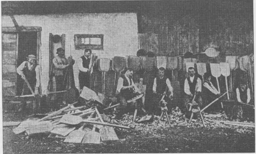
Grobo izdelane predmete v gozdu so dokončno izdelali doma, Leto 1901