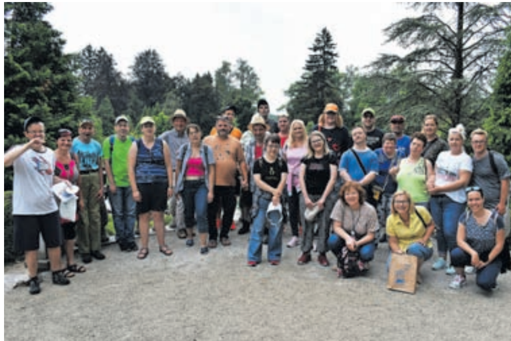
Uporabniki Varstveno-delovnega centra Sožitja Kamnik v Arboretumu