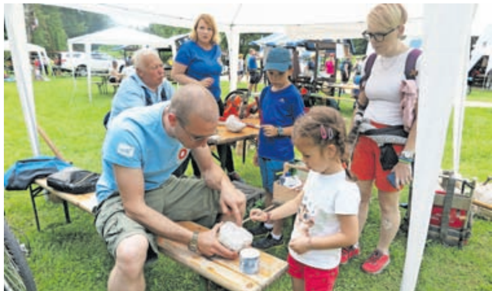
Kamniški markacisti so k risanju markacij pritegnili tudi najmlajše.

Člani PD Kamnik so za planince in gorske kolesarje iz vse Slovenije ta dan pripravili več vodenih tur. Pri Jurju v Kamniški Bistrici pa nato tudi prikaz dejavnosti različnih organizacij, ki so tako ali drugače povezane s planinstvom – gorski reševalci so pripravili prikaz vaje reševanja z drevesa, najmlajši so se lahko preizkusili na plezalni steni ali se zabavali v planinskem koticu, svoje dejavnosti so predstavili kamniški jamarji, ki so ob tem pripravili tudi okušanje vode iz različnih izvirov. Kako zabiti klin, postaviti stopnico ali narisati markacijo, so predstavili markacisti. Ker gora sploh zadnja leta ne osvajamo več zgolj peš, ampak tudi s kolesi, so obiskovalci pri stojnici trgovine Špica šport lahko testirali e-kolesa. Obiskovalci so si lahko ogledali opremo, s katero planinski svet obiskujejo invalidi, prelistali in ku-