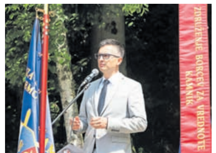
Minister za obrambo Marjan Šarec

Zbrani so sprva minuto molka namenili spominu na nedavno umrlega Borisa Pahorja, nato pa prisluhnili govornikom, med njimi tudi Marjanu Šarcu, ki se slovesnosti redno udeležuje vsa leta, tokrat pa je prišel v vlogi ministra za obrambo. »Vse slovesnosti, kakršna je tudi današnja, so žive priče grozot vojne, ki so se dogajale tudi na tem območju. Vsaka vojna je zlo in kdor je doživel vojno na lastni koži, zagotovo nikdar ne bo vojni hujskač. Vojno so vedno sprožali tisti, ki so bili skriti nekje po salonih in daleč od ljudi in so načrtovali, kako bodo spreminjali svet, v smrt, vojno in trpljenje pa pošiljali mlade fante. Tudi slovenski fantje so vse prevečkrat umirali za tuje inte-