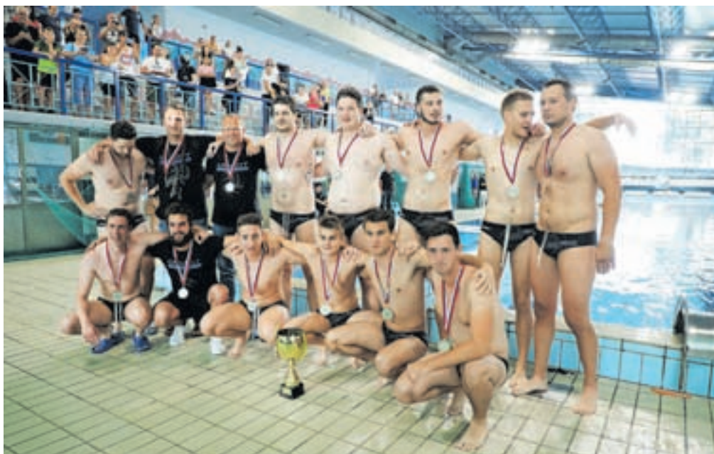
Kamniški waterpolisti s srebrnimi medaljami / FOTO: TINA DOKL

V finalu jih je pričakala letos nepremagljiva ekipa Triglava. V prvi tekmi so Kranjčar