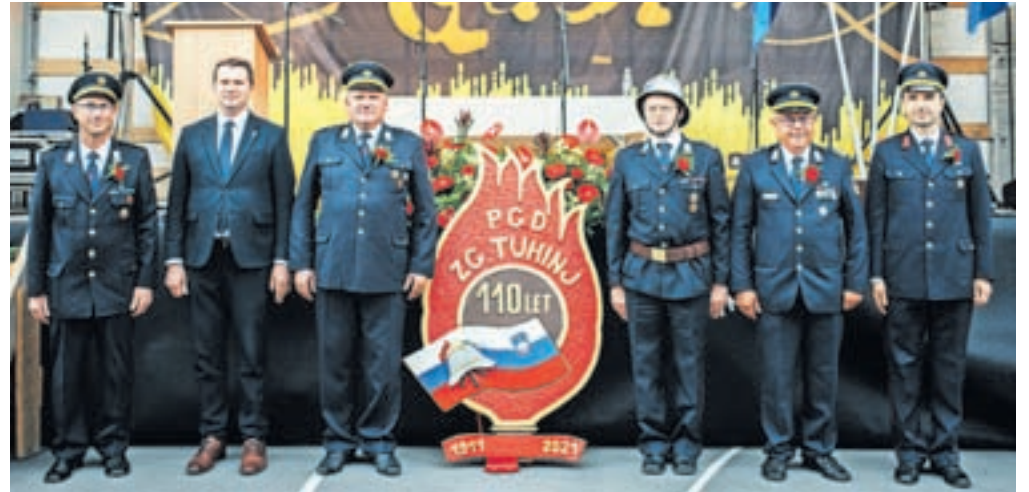
Prostovoljno gasilsko društvo Zgornji Tuhinj deluje že 110 let.