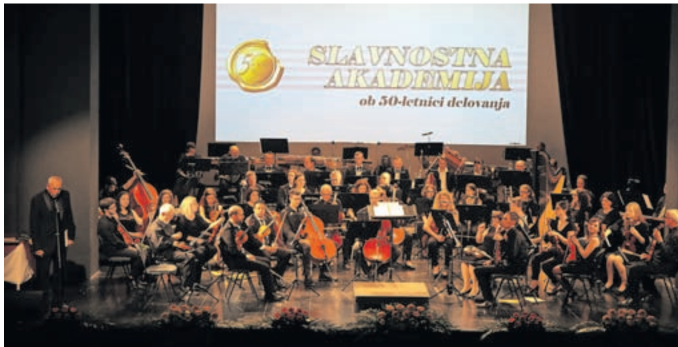
Simfonični orkester Domžale - Kamnik na akademiji ob 50-letnici delovanja