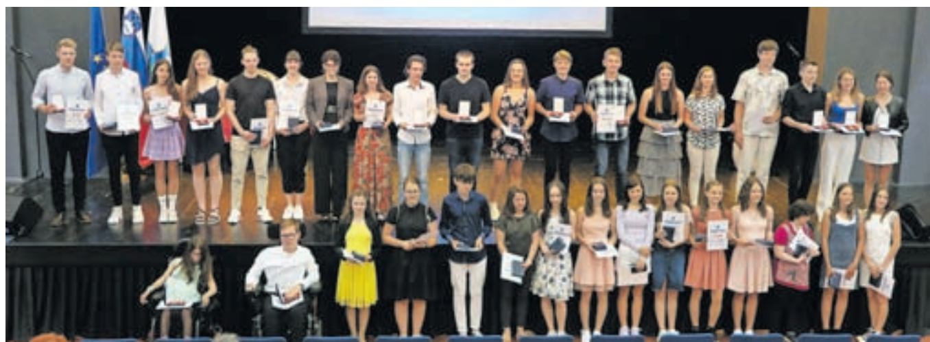
Prejemniki priznanj najboljšim učenkam in učencem, dijakom in dijakinjam