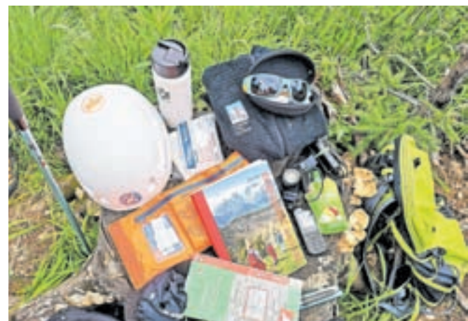
Pred odhodom na planinski izlet načrtujemo pot, v gore pa se vedno odpravimo z nahrbtnikom z obvezno planinsko opremo.