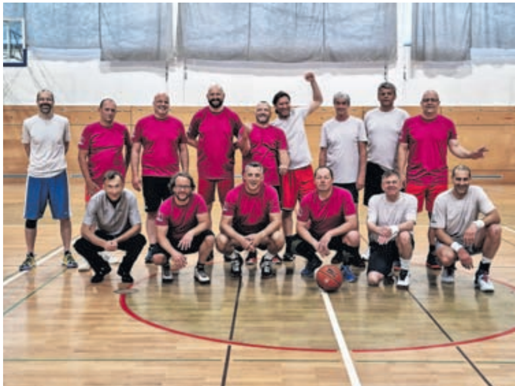
Člani obeh ekip

Po končani tekmi so igralci nadaljevali druženje ob dobri hrani in pijači ter se že dogovorili za tekmo v naslednjem letu. Hvala sponzorjem in vsem drugim, ki so kakorkoli pomagali, saj brez njih tekme ne bi bilo.