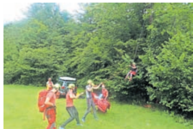
Gorski reševalci Društva GRS Kamnik so prikazali reševanje z drevesa.

Na Planinski zvezi Slovenije so pred poletno planinsko sezono opozorili, da so najboljše naložba za varnejše obiskovanje gorskega sveta