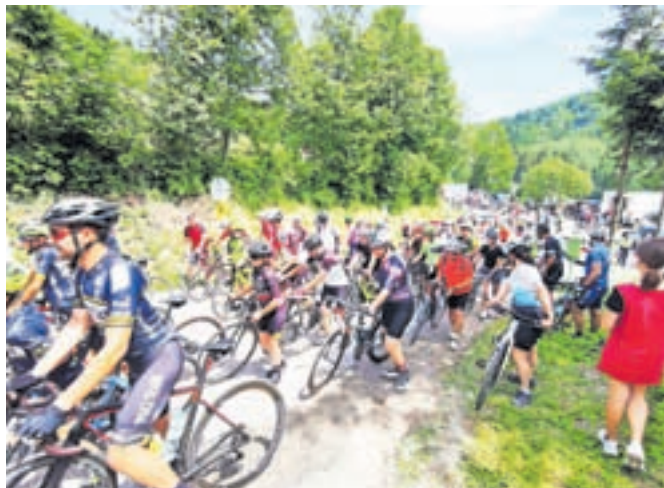
Ko ima človek občutek, da grejo vsi na Veliko planino: kolesarski zastoj navijačev na Črnicu. / FOTO: JASNA PALADIN

Proti cilju na Veliki planini so navijači začeli prihajati