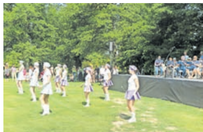
Na odru pihalnih godb so nastopile tudi kamniške mažoretke.

Volčji Potok – V Arboretumu so se v soboto, 18. junija, na povabilo Javnega sklada RS za kulturne dejavnosti (JSKD) oziroma njihovih več kot petdesetih območnih izpostav iz vse Slovenije na prvem festivalu Dan JSKD – Dober dan zbrali ljubitelji kulture in kulturni ustvarjalci od blizu in daleč. Zamisel za festival, ki naj bi odslej postal tradicionalen, se je porodila direktorju JSKD Damjanu Damjanovi-