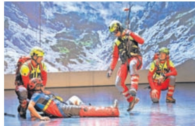
Gorski reševalci so reševanje s helikopterjem simulirali kar na odru Doma kulture Kamnik.

Dirka je v svet ponesla glas o Sloveniji kot odlični destinaciji za aktivne počitnice s poudarkom na trajnosti. Velika promocija je bila tako tudi za Kamnik. Slika z dirke je šla v več kot 130 držav Evrope, Azije, Afrike, Oceanije ter Srednjega vzhoda. Pokrivalo jo je 140 novinarjev.