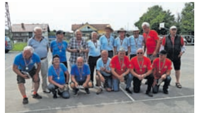
Najboljše moške ekipe v kegljanju na vrhovi

Ekipo je sestavljalo pet tekmovalcev, ki so imeli na vsaki stezi po deset metov, pet na polno, ko je postavljenih vseh devet kegljev, in pet na čiščenje, ko je treba podreti vse keglje. Za rezultat ekipe so šteli rezultati boljših štirih tekmovalcev na vsaki ste-