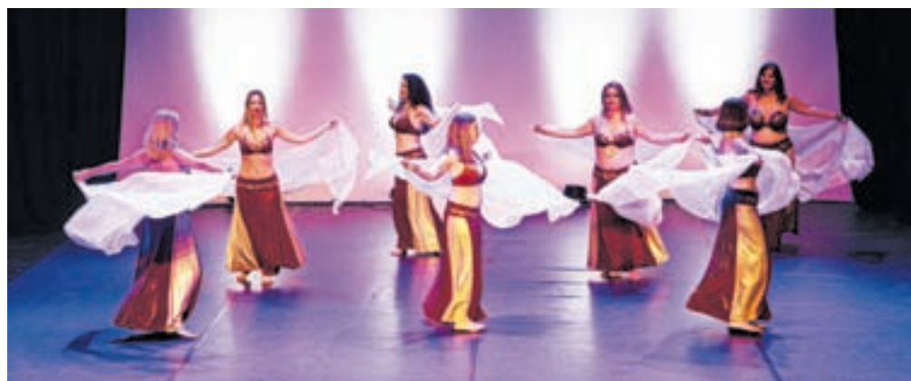
Plesni utrinek z letošnje produkcije Raks Bayani