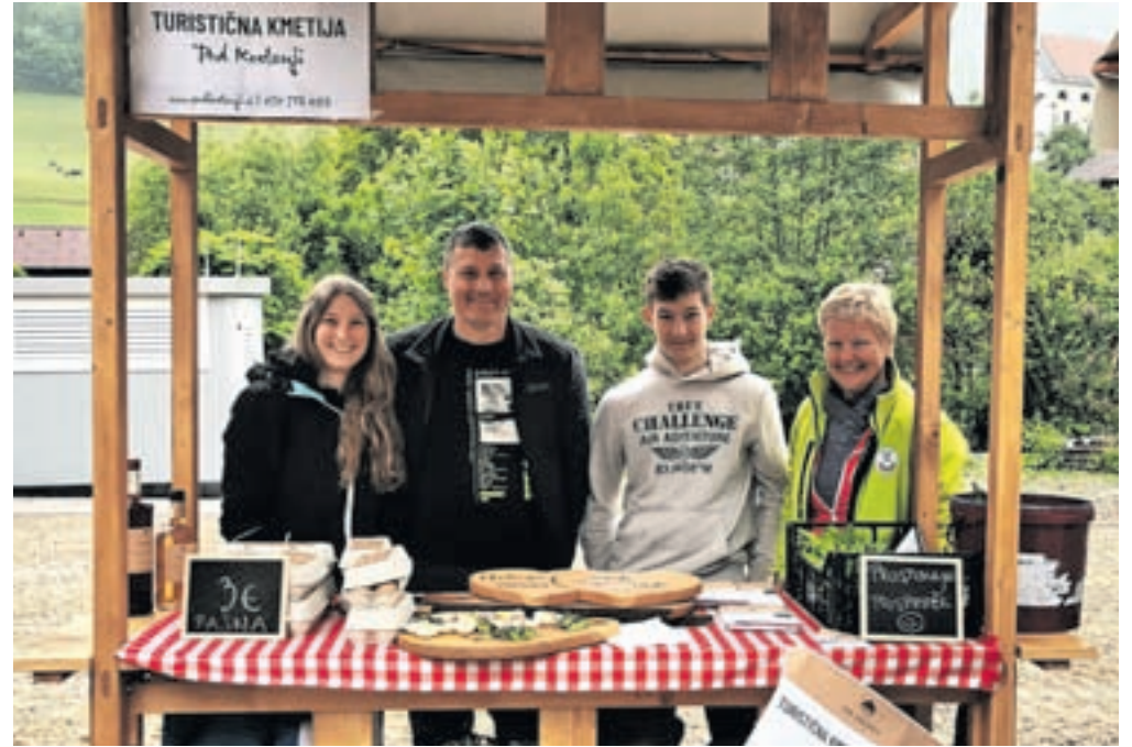
Družina s turistične kmetije Pod kostanji

Danes si marsikdo vzame čas, da gre pogledat želeni avtomobil v več salonov. Torej lahko stopite do več lokalnih kmetov in poižveste, kaj kmet proizvaja, ponuja ali celo lahko posadi za vas, da