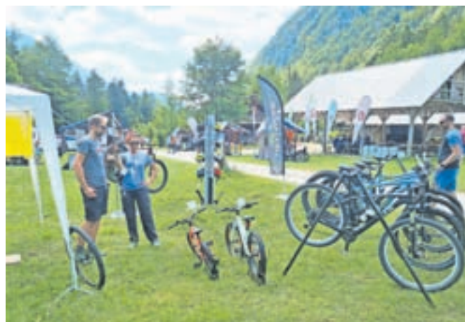
Ker hribov ne obiskujemo le peš, ampak tudi s kolesom, je bilo na stojnici trgovine Špica šport mogoče preizkusiti električna kolesa.

za varnejše gibanje v gorah. Poleg tega gorski reševalci beležijo zelo malo reševanj na organiziranih planinskih aktivnostih, kar je lahko še dodatno povabilo planincem, da se včlanijo v planinsko društvo in izkušnje nabirajo postopoma pod vodstvom vodnikov PZS.« Nesreča v gorah se lahko pripeti vsakomur in tudi najbolj usposobljeni posamezniki niso izjema, res pa je zelo malo reševanj na organiziranih planinskih aktivnostih, čeprav število posredovanj gorskih reševalcev narašča, kot kaže statistika Gorske reševalne zveze Slovenije (GRZS).