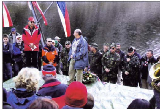
Tradicionalnega, že 8. pohoda, se je udeležilo približno 1000 pohodnikov, kar je največ doslej.