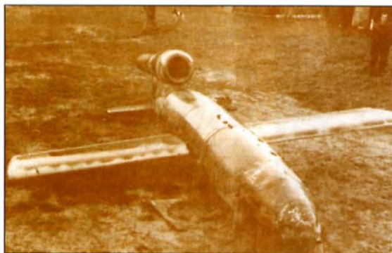
Nočna mora Winstona Churchilla so bile nemške letéce bombe z oznako V 1, s katerimi so obstreljevali London. Tako se je Hitler želel Britancem maščevati za letalska bombardiranja nemških mest.

Tudi Churchill si je obupano želel ponovnega srečanja. Kot pravi zgodovinar Andrew Ro-