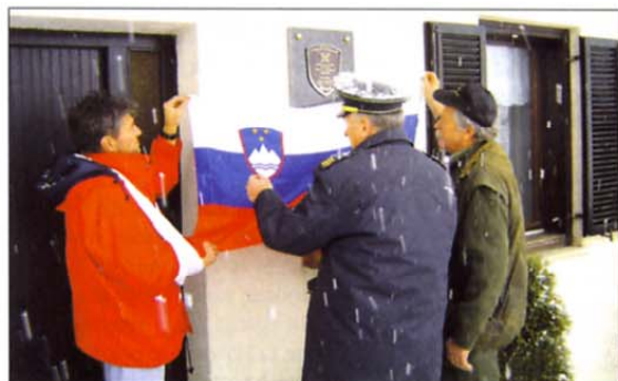
Junaška dejanja tistih, ki so imeli pred petnajstimi leti toliko poguma, da so na svojih domovih skrili večje količine orožja in streliva bodo večno zapisana v zgodovini slovenskega naroda. Tudi v Zasavju so na njihovih domovih novembra odkrili spominske znake.