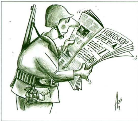
Horoskop? Za vojake strogo prepovedano!