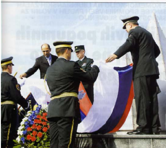
Odkritje spomenika in predaja zastave