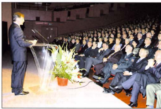
Udeležence proslave je najprej nagovoril minister za obrambo Karl Erjavec.

prilagojen realnim političnim in vojaškim razmeram. Tveganje je bilo veliko. Takšna pa sta bila tudi cilj akcije in motivacija sodelujočih. To je bil čas velike zagnanosti, silnega tveganja posameznikov in predanega domoljubja. Čas, ko so se v glavah rušili pregrade in predsodki o možnem in nemogućem, dovoljenem in prepovedanem, pravičah in odgovornostih, zvestobi narodu in zvestobi ideologiji. Rušilo se je veliko tega, kar je bilo cementirano v dolgih desetletjih starega štetja. Nov čas je terjal novega, bolj svobodnega in pogumnega posameznika. In projekt MSNZ je združil dovolj teh potencialov v narodu, da je bil uspešen.