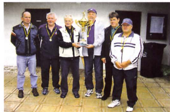
Trije najboljši veteranski teniški pari