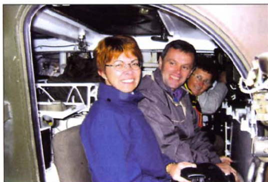
Nežni spol v trdem oklepu

Letos so obiskali Maribor, kamor so z dvema avtobusoma odpotovali v zgodnjih jutranjih urah 8. oktobra. Obiskali so Vojašnico generala Maistra, in sicer 74. oklepni bataljon. V njihovi spominski sobi so si ogledali bojno in razvojno pot od nastanka enote do današnjega dne. Začetki enote so bili v protiolepnih spopadih v območju Šentilja. Bogata zbirka fotografij, ukazov in muzejskih eksponatov pa še bolj popestri vero v trdnost in pomembnost enote. V nadaljevanju obiska v 74. OKMB so veterani spoznali razpoložljiva oklepna in protiolepnna sredstva. Videli so učinke protiolepnih sredstev, spoznali pa so tudi moč oklepnih vozil in od njih mogoče nevarnosti. Člani veterani so bili presenečeni in počaščeni, saj so jih pripadniki enote nenehno