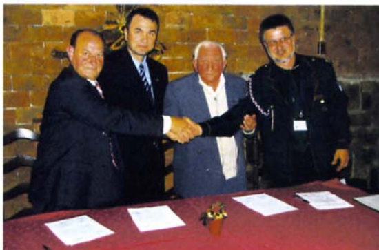
Združenja veteranov in častnikov Slovenske Istre in Bujskega območja so podpisali listino o sodelovanju.

molu Katerina znak za začetek in na pot je v teku krenila ekipa OZ VVS slovenska Istra. Za njo so krenila moštva pohodnikov Ankaran-Triglav, častniškega združenja Buj, Gasilske brigade Koper, častniškega združenja Buzeta, 430. mornariškega divizio-