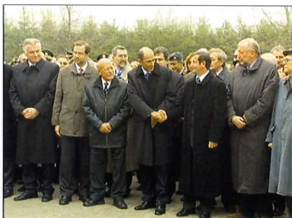
Na prireditvi v Poljčah se je zbrala velika večina akterjev vseh treh pomembnih dogodkov, ki so se zgodili pred petnajstimi leti.

V SPOMIN NA DOGODKE, KI SO NAKAZALI, KAKO POSTATI SAMOSTOJEN