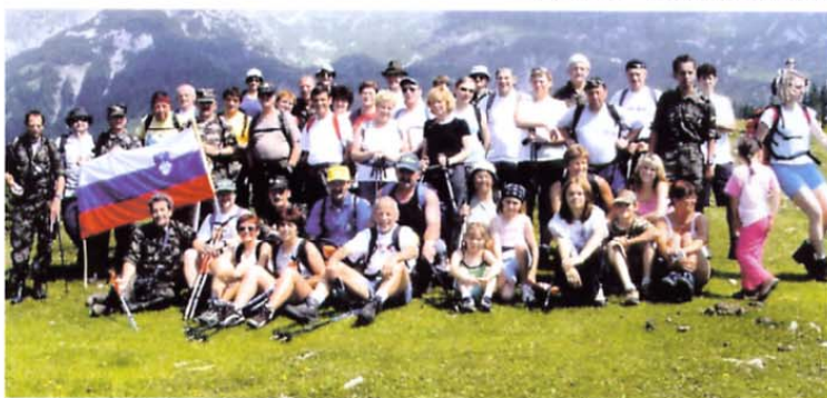
Udeleženci 5. pohoda po poteh TO