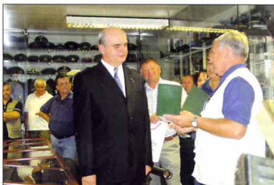
Utrinek z obiska v vojaškem muzeju v Logatcu