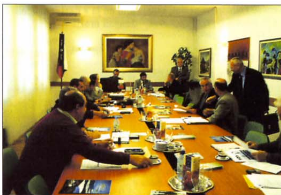
Utrinek s 6. seje predsedstva ZVVS