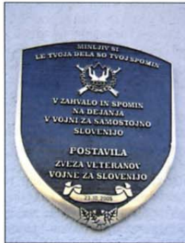
Spominska plošča, ki krasi hiše Arbatjerjevih, Zidanškovi in Kotnikovih.