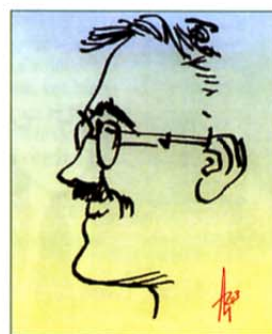
Pripravlja: Milan Alašević