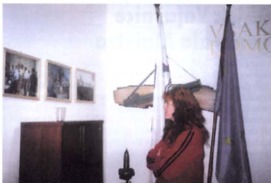
Ena izmed pripadnic logistične enote SV iz vipavske vojašnice med ogledom fotografij, ki so razstavljene v veteranskem domu na Kambreškem.