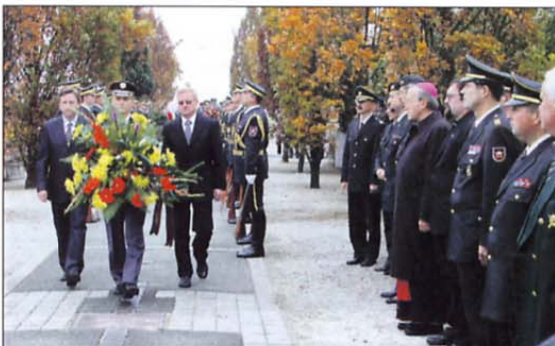
V spomin na žrtve vojne leta 1991 je venec položila delegacija Združenja Sever.