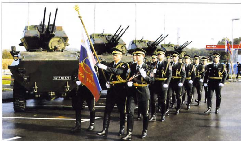
Prihod častne enote SV

Slovesnost, katere se je udeležilo več kot 1500 ljudi, je s prihodom in nagovorom počastil tudi predsednik Vlade Republike Slovenije Janez Janša, ki je bil 15. maja 1990 z izvolitvijo Izvršnega sveta Republike Slovenije imenovan za sekretarja sekretariata za obrambo in bil eden glavnih organizatorjev osamosvojitvenih procesov. Iz njegovih besed je bilo mogoče razbrati, kako dobro se spominja vseh dogodkov, povezanih s kolono oklepnih vozil, ki je 27. junija 1991 v zgodnjih jutranjih urah prestopila meje mlade slovenske dr-