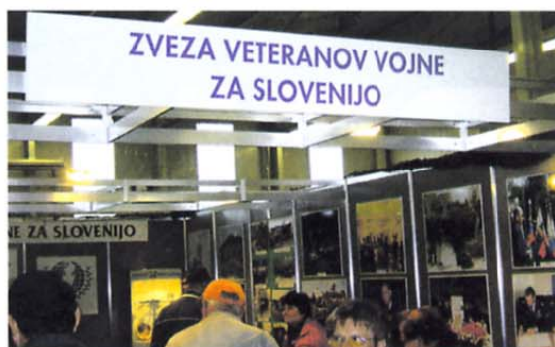
Na lično urejeni stojnici se je na radgonskem sejmu predstavila tudi Zveza veteranov vojne za Slovenijo. Obiskovalce so pritegnili številni fotozapisi in drugo gradivo iz vojne leta 1991