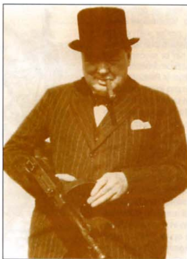
Feldmaršal Alan Brooke je o Winstonu Churchillju v svoj dnevnik zapisal: »Britanci ne vedo, kako nevaren je. Anglija bi bila brez njega izgubljena, z njim pa je na robu katastrofe.«