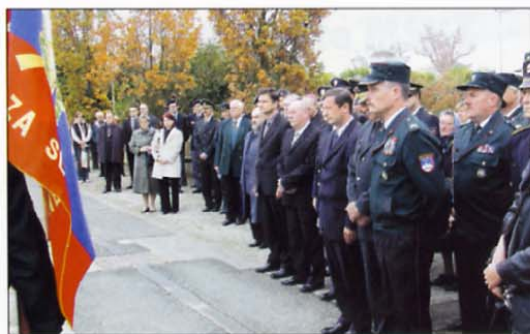
Dejstvo je, da se na komemoraciji vsako leto zbere več ljudi. In prav je tako!