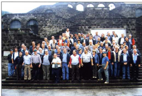
Z izleta v Kobarid

V začetku oktobra so na izlet v Belo krajino prišli veterani iz OZVVS Litija. Seznanili so jih z dogajanjem na območju Bele krajine leta 1991. Udeležili so se tudi odkritja spomenika v Krakovskem gozdu ob obletnici izгона zadnjega vojaka JLA iz Slovenije. Na slovesnosti so bili tudi belokranjski veterani člani, ki so leta 1991 tam aktivno sodelovali v takratnih bojih. Konec oktobra so tudi belokranjski veterani zaznamovali 15. obletnico MSNZ, kar je opisano v drugem članku. Oktobra so bili kar delavni, saj so organizirali še tradicionalni kosanjev piknik na Smuku nad Semečim. Poleg njihovih članov so z veseljem sprejeli še povabljenega delegacije veteranov sosednjih OZVVS Dolenjska Novo me-