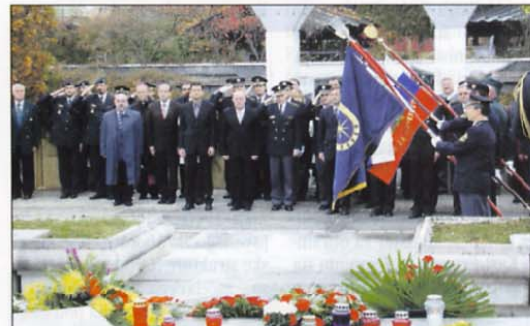
Minuta molka v spomin padlih