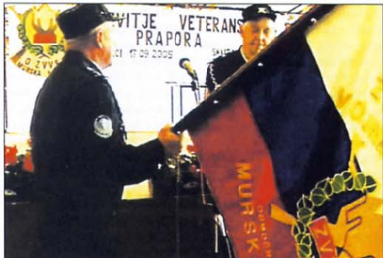
Sedaj ima svoj prapor tudi OZVVS Murska Sobota.