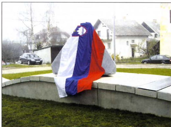
Tetraeder simbolizira neprebojnost obrambe v vojni za Slovenijo.