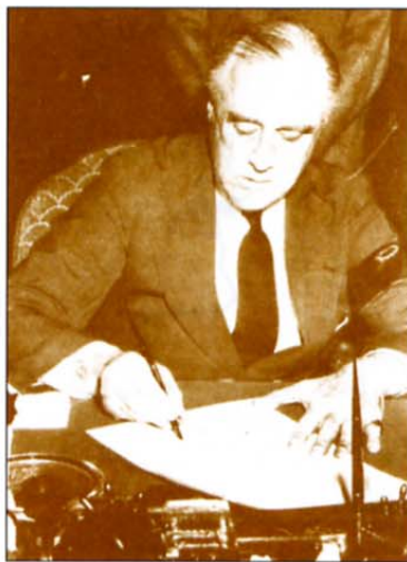
Ameriški predsednik Franklin Delano Roosevelt je bil proti koncu vojne hud bolnik; imel je težave s srcem in visokim krvnim pritiskom, mučile so ga posledice otroške paralize. Kljub temu je bil neomajen, da je treba Nemčijo popolnoma poraziti.