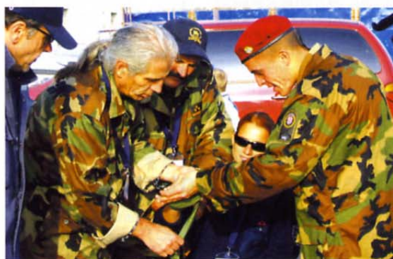
Moštvo častnikov iz območja Buj oskrbuje ranjenca.