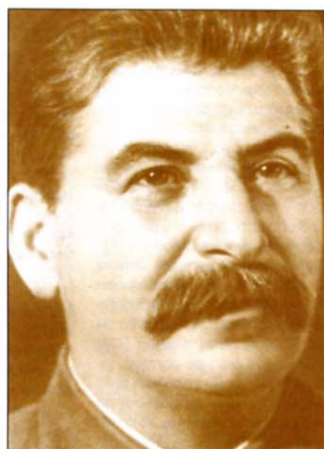
Imperij, ki ga je Josip Visarionovič Džugašvili - Stalin gradil, je temeljil na človeških truplih. V njegovih očeh ni bilo človeško življenje nič vredno.

OB OBLETNICI ZMAGE NAD NACIFAŠIZMOM IN KONCA DRUGE SVETOVNE VOJNE