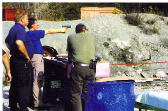
Strelišče v kamnolomu pri Černotičah. Roka je še vedno mirna.