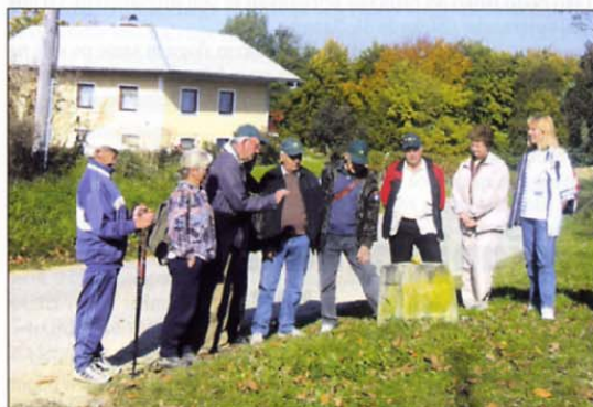
Skupina pohodnikov med ogledom ene od lokalnih znamenitosti.