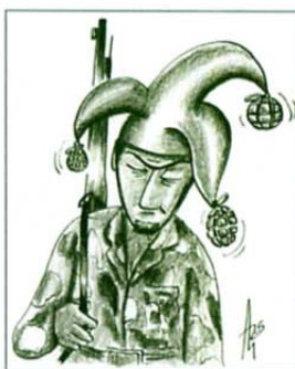
»Le kaj mi je treba okoli pripovedovati šale?«