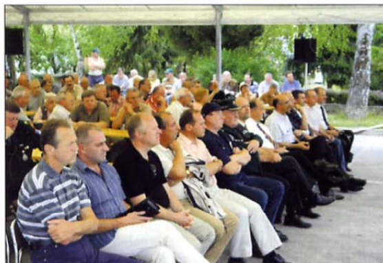
Veterani in njihovi gostje so skupaj obudili spomin na negotove čase pred našim osamosvajanjem in med njim.

tajno delovala od maja do oktobra 1990. MSNZ je bila organizirana na celotnem slovenskem prostoru. Vodili so jo takratni minister za obrambo Janez Janša, minister za notranje zadeve Igor Bavčar in Anton Krkovič, načelnik MSNZ Republike Slovenije. V tej sestavi je delovalo še 13 pokrajinskih in