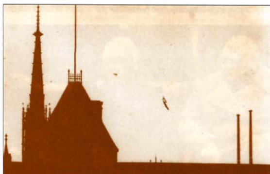
Letéča bomba med padanjem na London

morali znati napovedati sovražnikove poteze. Razumeli so, zakaj Hitler napada Veliko Britanijo z izstrelki V 1. Po njihovem mnenju je bil Hitler kot kockar, ki ima le še en kovanec, pa bi rad z njim zmagal. Z letelimi bombami je hotel Churchilla prisiliti, da bi popustil. Četverka ni mogla razumeti, da se Britanci in Američani niso dogovorili s Hitlerjem za premirje.