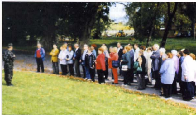
Veterani, častniki in borci med ogledom vojašnice generala Maistra v Mariboru.