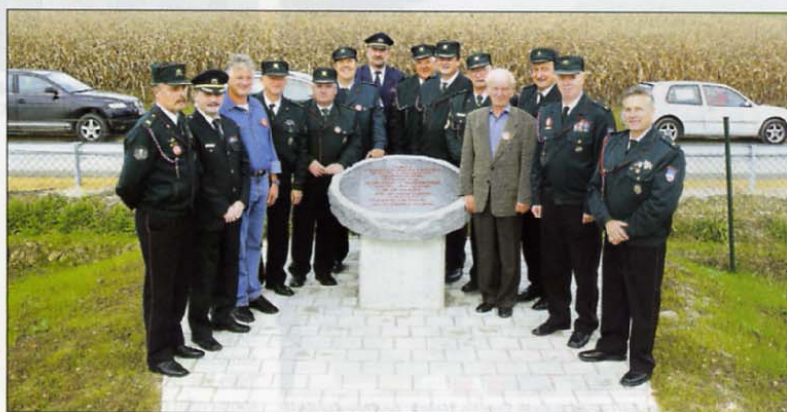
Ob spominski plošči