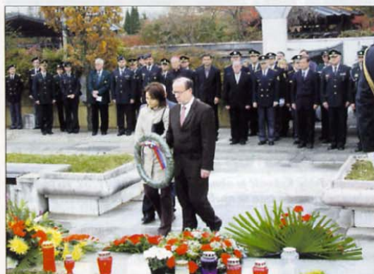
Venec je položila tudi delegacija Ministrstva za delo, družino in socialne zadeve.