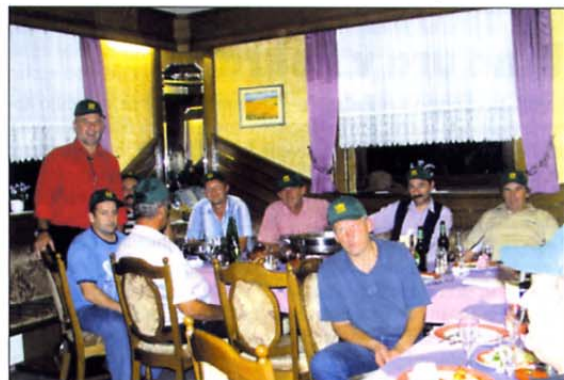
Del pripadnikov nekdanjega 174. protidiverzantskega voda TO Brežice na letošnjem srečanju