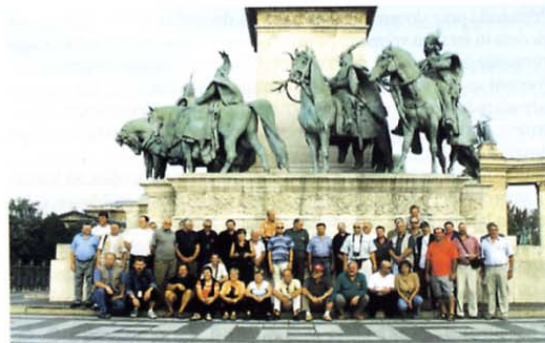
Slovenski heroji na Trgu herojev