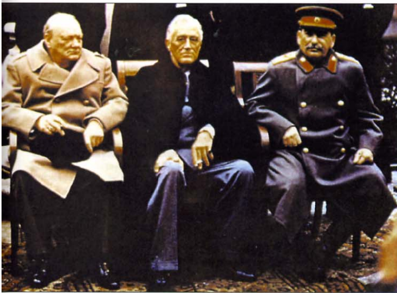
Skupni posnetek velike trojke iz druge svetovne vojne. Od leve proti desni so Winston Churchill, Franklin Delano Roosevelt in Josip Visarionovič Džugašvili - Stalin. Fotografija je nastala februarja 1945 med njihovim sestankom v sovjetskem letovišču Jalta na obali Črnega morja, kjer so določili vplivna območja po svetu.