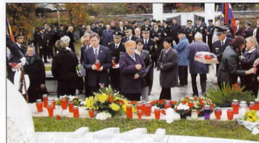
Ob koncu komemoracije so zagorele številne svečke in sveče.