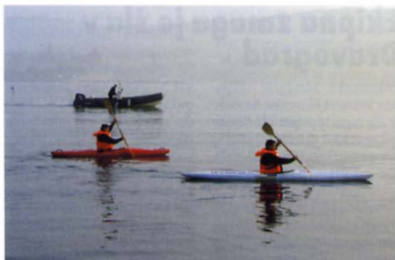
Tekmovalci so se pomerili tudi v veslanju.