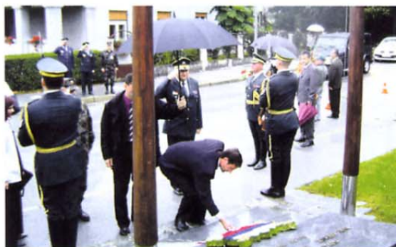
Pred odprtjem sejma je minister za obrambo Karl Erjavec položil venec k spomeniku padlim za Slovenijo v Gornji Radgoni.