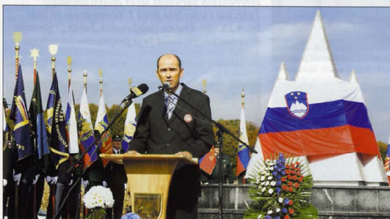
Slavosni nagovor premierja Janeza Janše