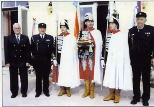
Med obiskom na Madžarskem so naši veterani videli veliko lepega, poseben vtis pa so na njih naredili bojevniki v zgodovinskih kostumih.

vili koledar dejavnosti ZVVS leta 2006. Z njim smo letos pohiteli, saj nas drugo leto čaka praznovanje v počastitev 15. obletnice vojne za Slovenijo, ko bodo tudi območna združenja pripravila