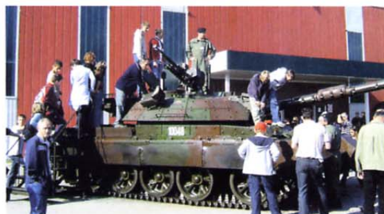
Obiskovalci sejma so lahko uživali v dinamičnih predstavitev vojaške tehnike in izurjenosti enot Slovenske vojske ter si ogledali njeno opremo.

Obiskovalci sejma so lahko uživali v dinamičnih predstavitev vojaške tehnike in izurjenosti enot Slovenske vojske. Med drugim so si ogledali gašenje požara in reševanje s helikopterjem, vožnje z lahkim protiklepnim vozilom valuk in hummer, vožnje prek lansirnega mostu eurobridge, prikaz manevrskih sposobnosti tanka M 84 in predstavitev uporabe tanka nosilca mostu. Prikazani so bili tudi dekontaminacija ljudi in materialno-tehničnih sredstev, delovanje vodnikov službenih psov, spretnostne vožnje s službenimi motornimi kolesi ter spretnosti gorniškega bataljona in gardne konjenice