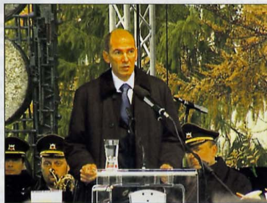
Slavnostni govornik je bil predsednik slovenske vlade Janez Janša.

svojitve zavarovati z realno silo? Na tem mestu, v Poljčah, v Centru za obrambno usposabljanje, je bila kasneje po plebiscitu vrsta sestankov, dogodkov, usposabljanj, s katerimi smo dejansko postavili temelje za zavarovanje slovenske osamosvojitve z realno silo. Tukaj se je začelo aprila 1990 usposabljanje poveljnikov enot TO, poveljnikov, ljudi, častnikov, ki so prevzeli na svoja ramena odgovornost za usposabljanje prve generacije slovenskih nabornikov. Te smo poklicali na služenje vojaškega roka v Slovensko vojsko praktično na podlagi novega zakona o vojaški dolžnosti, ki pa smo ga na žalost v parlamentu izglasovali z enim glasom večine. To dejstvo je bilo izjemno pomembno. Ne samo zaradi ne-