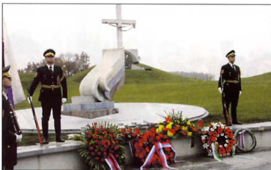
Spomenik padlim v vojni za samostojno Slovenijo na ljubljanskih Žalah