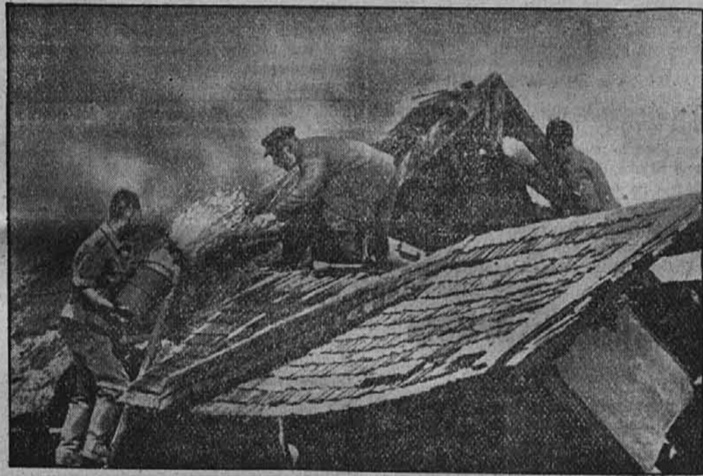
Sovjeti požigajo — nemški vojaki gasijo.

V pogledu uprave so manjkali v Ukrajini vsi pogoji. Morda še obstoječih sovjetskih upravnih teles, ne glede na vse drugo, večinoma že zgolj zaradi tega niso mogli ra-