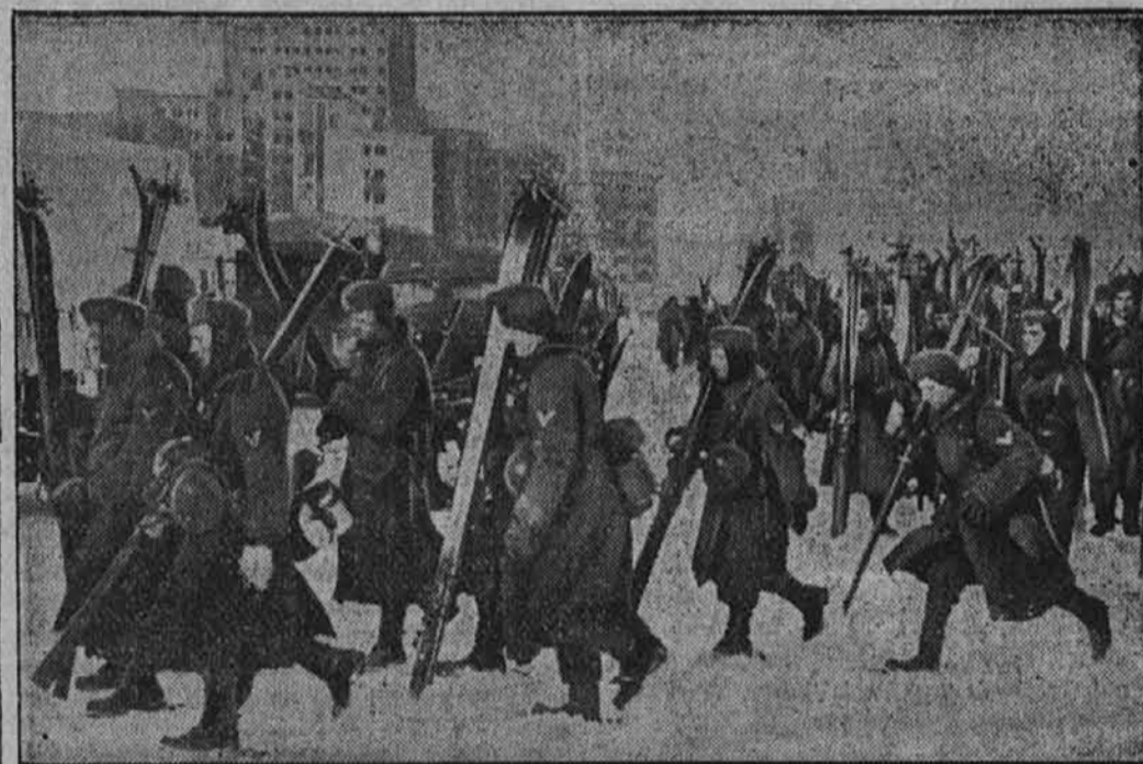
Smučarski-lovski oddelek odhaja.

Dosti truda in napora je stalo, predno so ga med snežnimi viharji zgradili v globoko zmrznjeni zemlji.