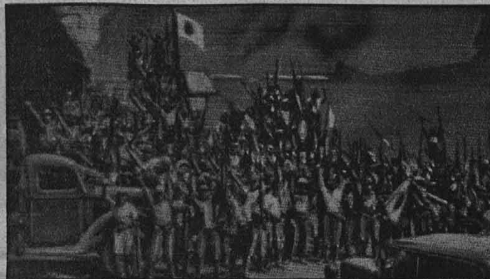
Prva brezžična slika o zmagovalnem vkorakanju Japonskih čet v Singapur.