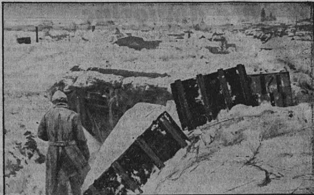
Sedaj je bunker gotov.

Iz gozdnega taborišča. Mlad upornik je ležal zleknjen pod košato smreko. »Ce bi vedel Churchill, kako sem lačen,« je modroval sam pri sebi, »tedaj bi mi gotovo poslal kaj boljšega za želodec.« Takrat je nad njim v drevesu nekaj zašumelo. Iz gnezda visoko med vejami, kjer so gnezdili jaстреbi, mu je padla prav na usta — kurja glava. »Prokleti lord!« je zarobantil. »Kljun mi pošilja, meso je pa sam pojedel.«