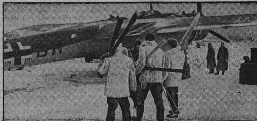
Tu letalska posadka nesme pozabiti smuči.

Sestoja iz prostovoljcev iz preskrbovalnih čet. Zapušča Charkov, da se udeleži borb v odseku Doneca.