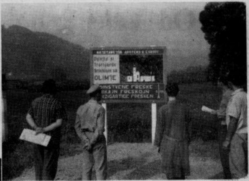
Tak kažipot so izdelali sami...