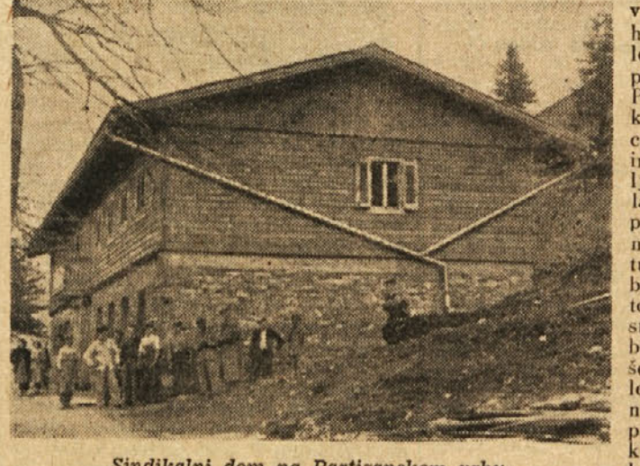
Sindikalni dom na Partizanskem vrhu, priljubljena izletniška točka v Zasavju