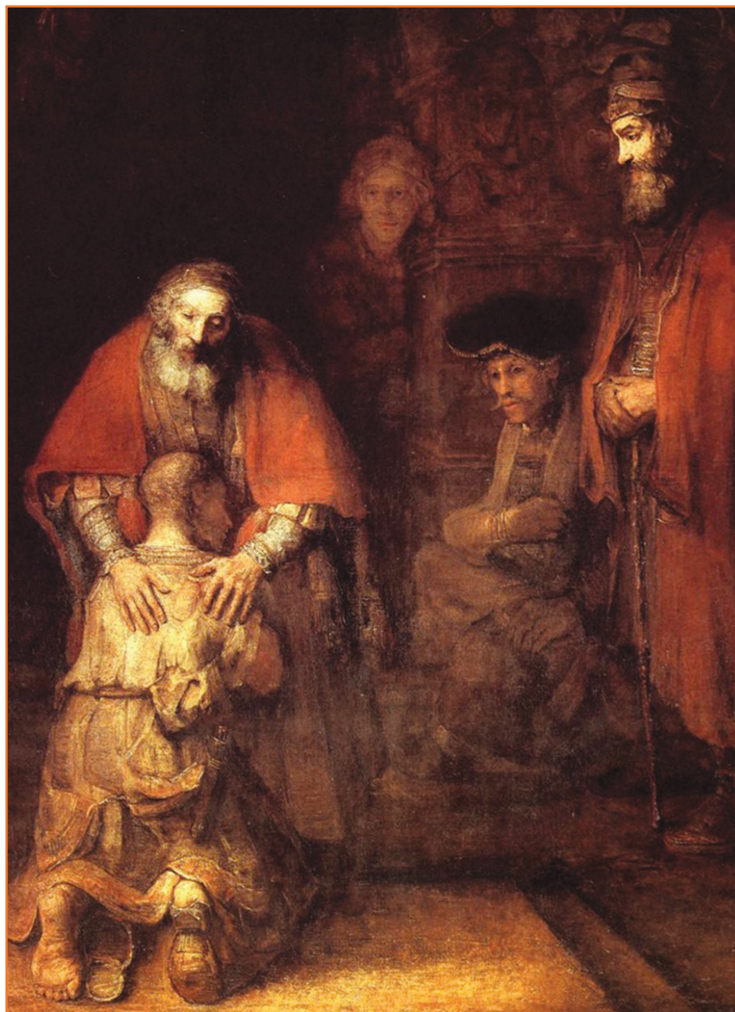
"Oče, ki mu je ime Usmiljenje. In ves je tak: majhen, sklonjen nad sina, objema ga, nekateri pravijo, da izgleda celo slep."