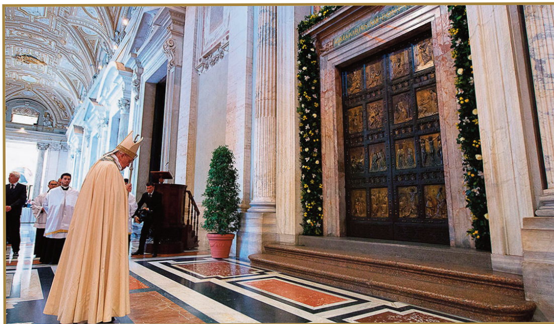
Ne morem doseči, lahko pa upam, da se pri teh vratih srečam s teboj.

vrata tako najprej vabijo, razbijajo stene predsodkov, ki jih premore naša Cerkev kot skupnost verujočih. Sveta vrata so