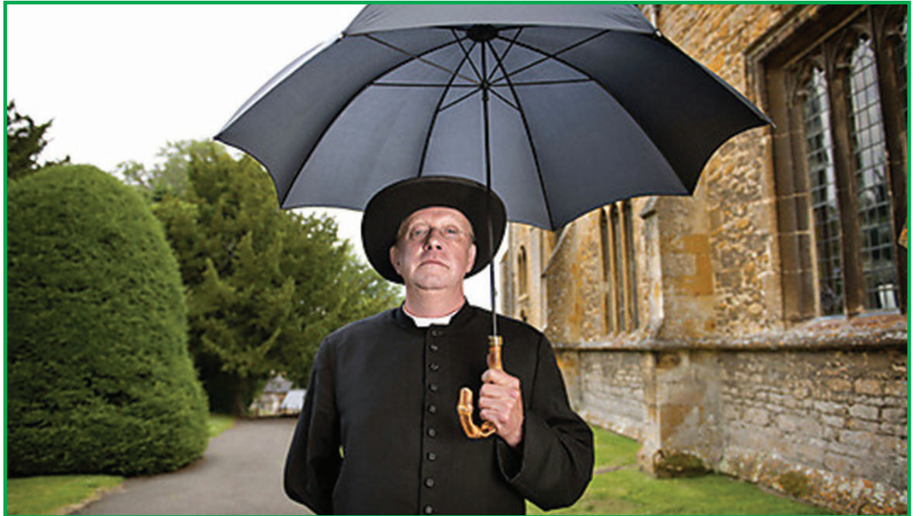
Oče Brown nas vabi, da bi se čim bolj poistovetili z bližnjim v njegovih dejanjih. To je pobožna vaja, da se osvobodimo egoizma, zagledanosti vase in nadutosti.

da ta gnev čutimo zato, ker je tako blizu ... Lahko bi imeli za grozen neki zločin zato, ker ga nikdar ne bi mogli storiti. Jaz ga imam za groznega zato, ker bi ga lahko storil". Torej je potrebno, kot nam pravi tudi sv. Tomaž Akvinski, nehati gledati na življenje tako materialno in na druge tako vzvišeno, po drugi strani pa tudi ne sebe jemati preveč resno, kot da ne bi bili česa sposobni: "Noben človek ni dober, dokler ne ve, kako slab je lahko". Pobožna vaja, ki jo predlaga oče Brown je zelo skladna z nauki sv. Ignacija v njegovem temeljnem delu