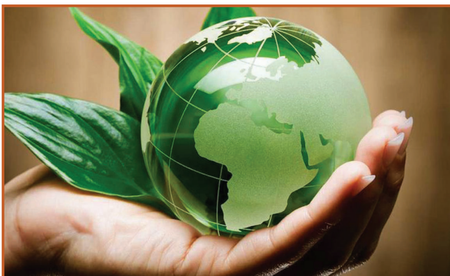
Vsekakor potrebujemo spreobrnjenje in spoštovanje narave, potrebujemo ekološko etiko, ki jo bo potrebno šele začrtati.

potrebna svetovno soglasje in svetovna vlada, kar pa bo gotovo omejilo suverenost posameznih držav. To pa ni brez nevarnosti.