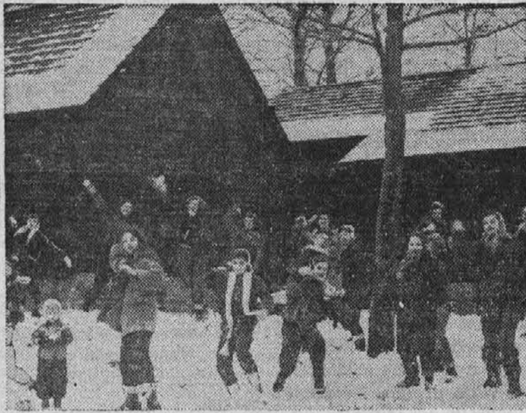
Girl Scouts can't wait for spring to try out their new camp site in Macedonia. The Cleveland Girl Scout Council will conduct a Neighborhood Appeal March 12-31 for funds to provide camping facilities for 3,040 more girls.

A mothers' march to raise $200,000 for additional camping facilities for Greater Cleveland Girl Scouts will begin in this neighborhood on Friday, March 12th, the forty-second birthday of the character-building organization.