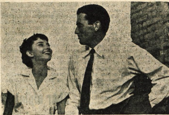
Audrey Hepburn in Gregory Peck

ga krasijo velike, nekoliko posevne oči, je tak, kot ga vsakdo rad vidi. Audrey je visoka,