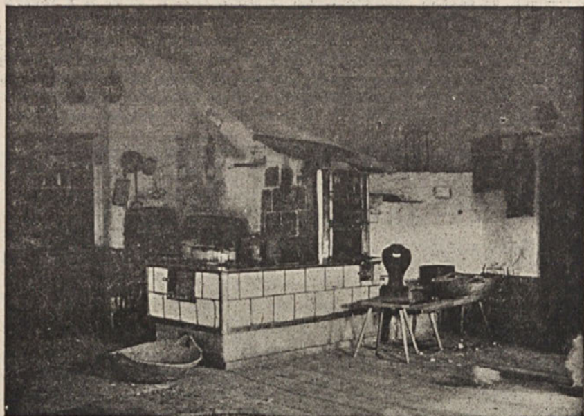
Pri črešniku v Spodnji Kapli.

kruh itd. Če pa je samo en »štiblc«, odgovarja ta po legi splošnoslovenski hišici ali mali hišici in združuje lastnosti velikega in malega »štiblc« ter tvori najbolj ozaljšani prostor v hiši.