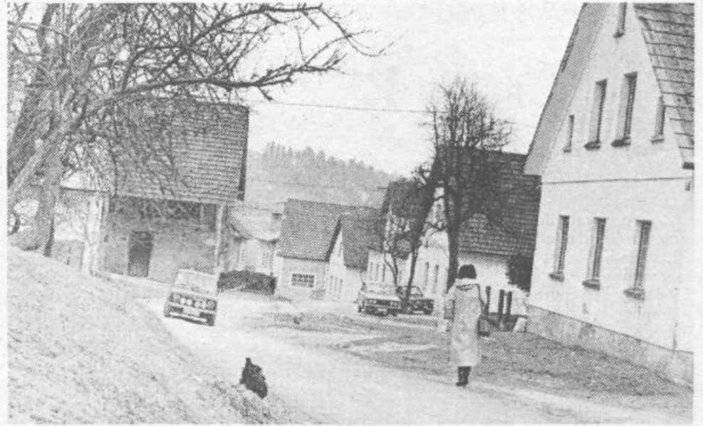
Asfalt bi rešil Zaklančane nadležnega cestnega prahu

Jože Prebil: »Kmetje pričakujemo, da bodo delavci TOZD Hidrogradnje upoštevali naše predloge ter, da bodo kmalu rešeni zemljiški zapleti na nekdanjih arondiranih površinah.«