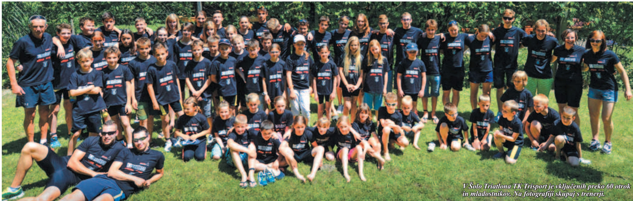
V Šolo Triatlona TK Trisport je vključenih preko 60 otrok in mladostnikov. Na fotografiji skupaj s trenerji.