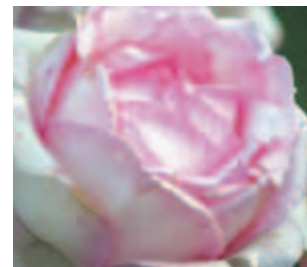
Najlepša vrtnica leta 2014 nosi ime »Honoré de Balsac«.