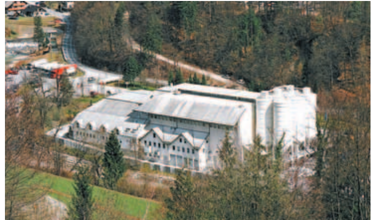
Obrat za predelavo kalcita v Stahovici.

Direktor Kim poudarja, da so v preteklosti finančno podprli marsikateri projekt v krajevni skupnosti in občini. »Pomagamo tudi šolam, gasilcem in krajevnim skupnostim, seveda pa gre največ denarja za šport, saj se bolj kot država in občina zavedamo pomembnosti zdravega načina življenja naših otrok. Calcit je pokrovitelj vrste športnih moštev in posameznikov