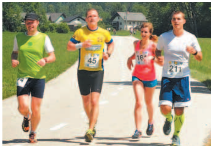
Trase tekov so potekale po izjemno lepih poteh, ki so ponujale razglede na okoliške hribe.