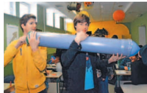
Topničarja z zračnim topom

»Drage učence, učenci, dijakinje, dijaki, ponosen sem na vas kot človek, kot župan Občine Kamnik. Celotna občina Kamnik je ponosna na vas.« To so bile besede župana Marjana Šarca, ko je na gradu Zaprice podelil knjižne nagrade najboljšim iz zaključnih razredov osnovnih oz. srednje šole.