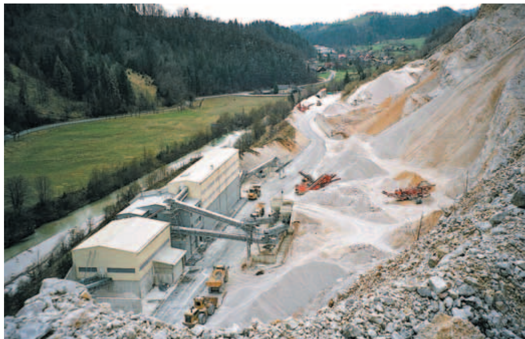
Kamnolom kalcita na pobočju Grohata v Stahovici.