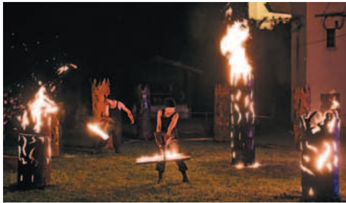
Motniško dogajanje je zaključil Ognjeni spektakel Kulturnega društva Priden možic.

Medtem, ko so obiskovalci motniške ugankarske poti dobesedno »zasedli« različne kottičke Motnika, je bilo pestro tudi v parku Podlipami. Tam je potekal sejemo do-