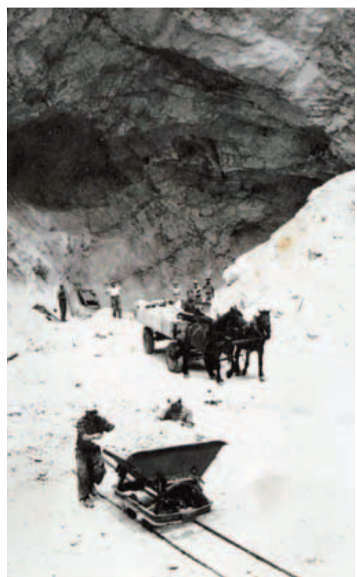
Začetno obdobje pridobivanja kalcita v Stahovici. Prevoz kamnine po kamnolomu in prevoz s konjsko vprego.