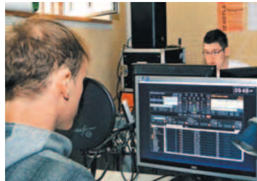
Prvi in za zdaj edini Radio Kamn'k v akciji