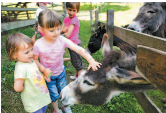
Nad pravljčnim sprehodom po Motniku z okolico so bili še posebej navdušeni otroci.

Glavni del programa se je odvijal v soboto, 7. junija. Že v zgodnjih dopoldanskih urah so organizatorji razveselili starše in otroke na Vranskem, kjer sta jim v znameniti