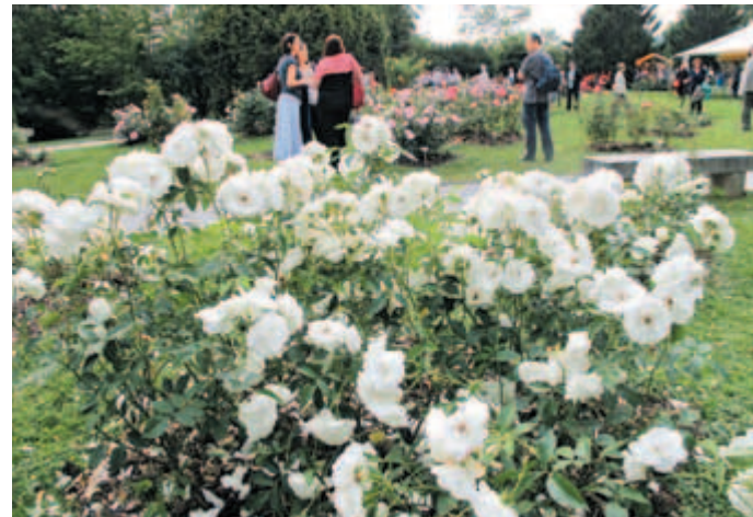
Na lanskim Nizozemski vasi je dobil Arboretum Volčji Potok v dar novo vrtnico »Repubblica di San Marino«. Ob dvesto drugih sortah je na ogled v rožnem vrtu.

Petek trinajstega ni bil vremensko najbolj posrečen dan za srečanje ljubiteljev vrtnic, toda zaradi dežja ljudje niso zapustili prireditve. Če že ne lep in sončen, je bil večer prijeten in poučen. Nekaj več kot sto ljudi je prišlo, da bi uživali med cvetočimi vrtnicami, da bi se o njih pogovorili in kaj novega naučili.