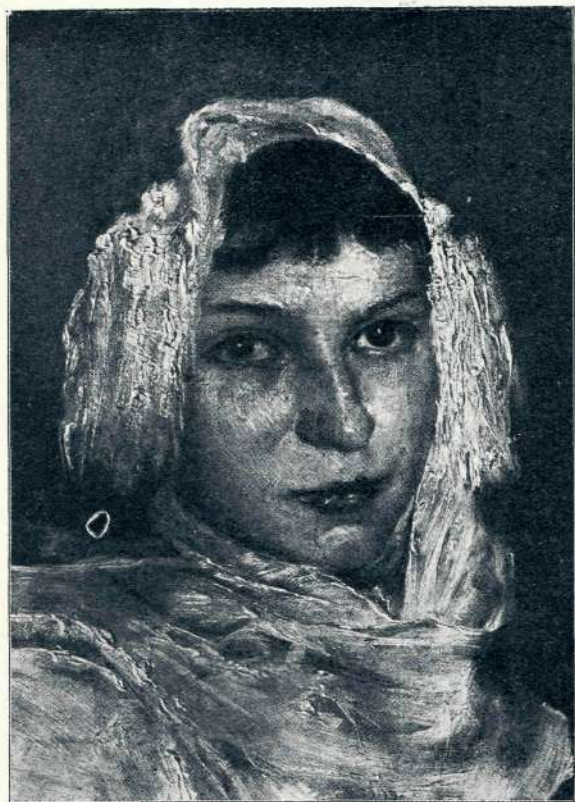
Ivana Kobilca: Portretna študija (1889/90)