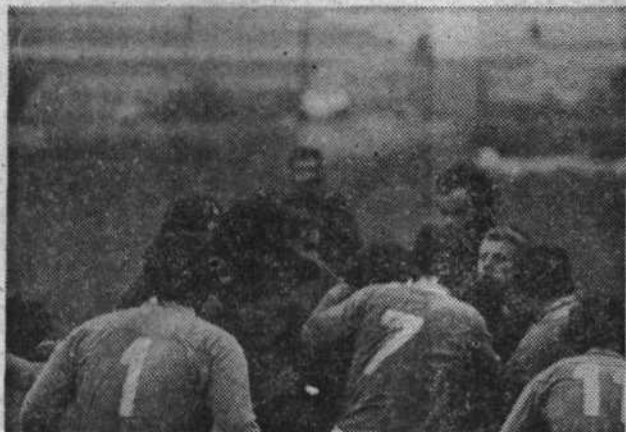
S finalne rugby tekme med Šiško in Bežigradom