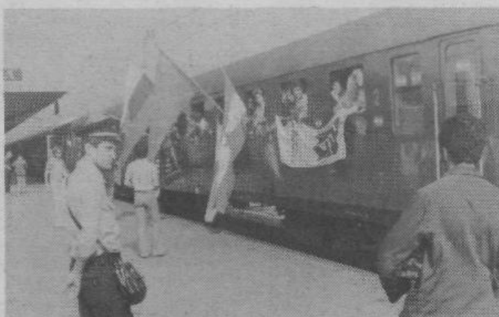
1. junija je odšla na delo naša prva brigada, in sicer v Kostanjevico pri Novi Gorici. Mladi bodo gradili vodovod, po programu sodeč pa bo dobršen del časa posvečen tudi izobraževanju. Delovna akcija naj bi zares postala šola samoupravljanja.