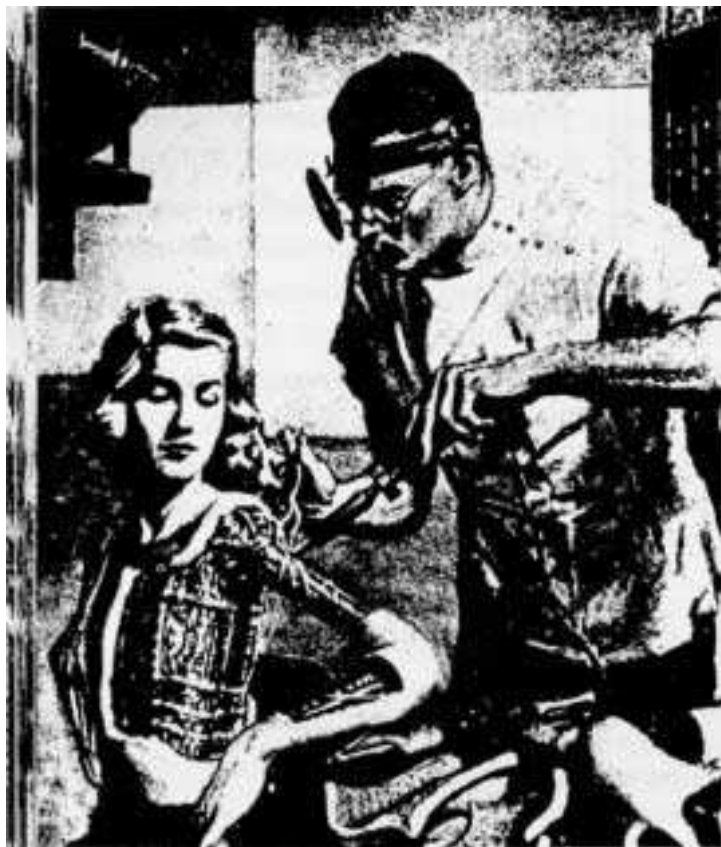
ilustracija iz zbornika CYBERPUNK

cyberspace, ICE, neuromancer, console cowboy, jack, wizard in veliko drugih, ki so danes osnova novega hekerskega linga. Gibson je eden prvih napovedal virtualno resničnost. Pri tem je šel še korak naprej - razdelil jo je na dvoje entitet: matrični cyberspace in mrežo