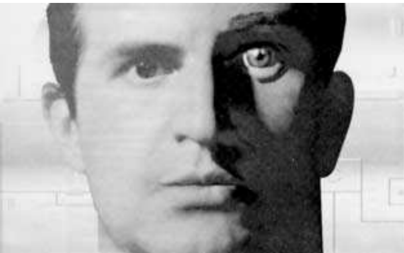
ilustracija iz revije OMNI

dram, reportaž, filmov, mininanzank, videospotov, tragikomedij, vklopi-in-zadeni tombol in vseh mogočih njihovih kombinacij se meša v ahistorični ponaredek - vsemogočni sataraš, ki bo teknil le nekemu namišljenemu povprečnemu gledalcu. Presek televizijskih izdelkov se giblje od izredno realističnih, ki jih snemalci ustvarjajo tudi vse svoje življenje, do najenostavnejših namensko zrežiranih zabavnih oddaj, ki so prežete z zaigrano iskrenostjo in karikirano resničnostjo. Ob tem je