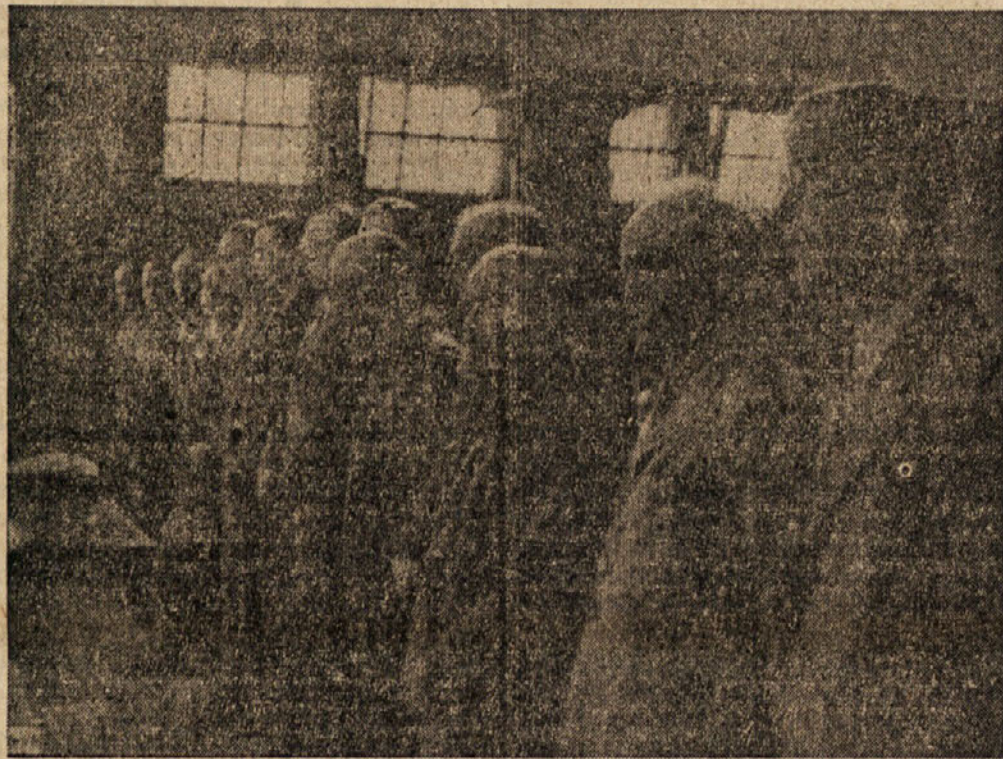
Obtoženci med branjem obtožnice pred vojaškim sodiščem v Ljubljani

»Združene države Evrope« so načrti mnogih evropskih in izvenevropskih politikov. V zadnjem času so kampanjo za »Združene države Evrope« znova poživili. To naj bi bila organizacijska oblika, ki bi povezala zapadne evropske države v močno enoto. Reakcionarji in imperia- listi si jo zamišljajo kot močan jez proti sovjetskemu vplivu in zlasti kot edi-