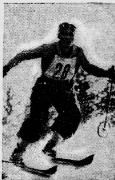
Švicarski smuški tekmovalc Rominger, svetovni prvak v slalomu