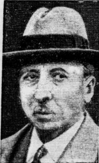
Francoski senator Leon Berard je po nalogu pariške vlade drugič odpotoval v Burgos k generalu Francu