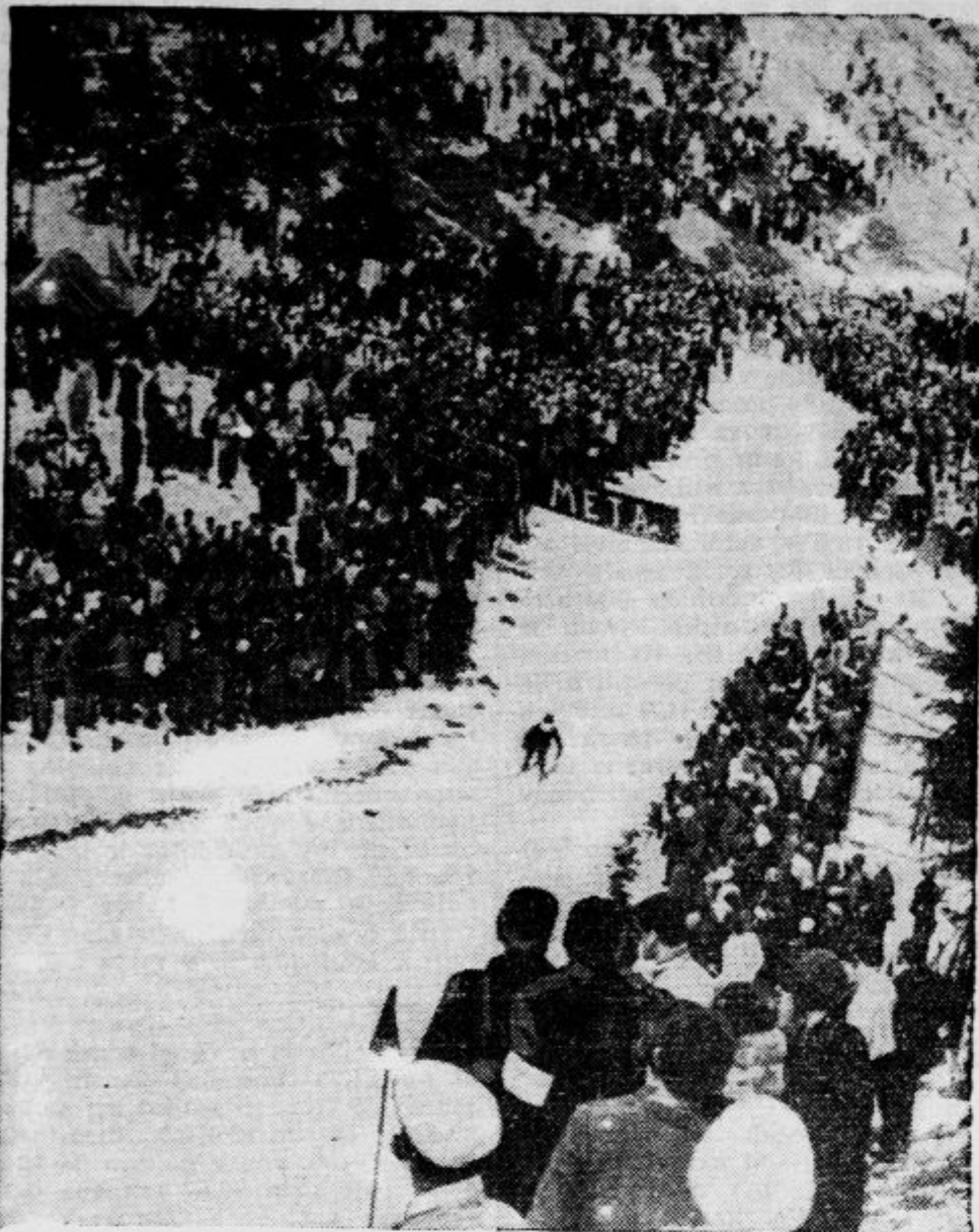
Oči vseh smučarjev in prijateljev belega sporta so zdaj obrnjene v Zakopane, kjer tekmujejo mednarodni smučarji ob veliki udeležbi občinstva