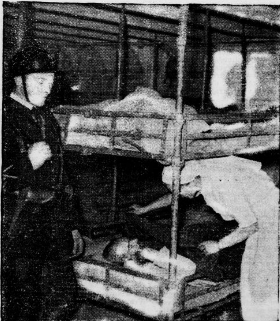
Francoska vlada je dala španskim beguncem, zlasti ranjencem, na razpolago prekomornik »Marechal Lyautey«, katerega so spremlili v lazaret