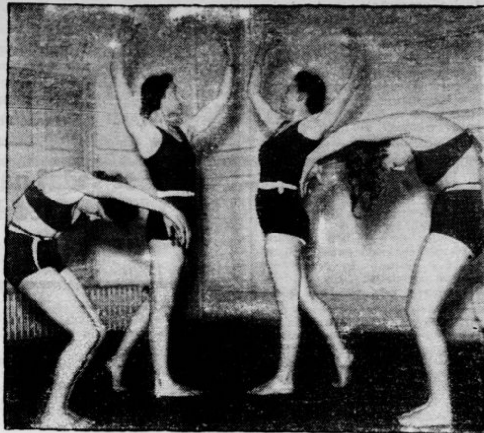
Moderna žena zna ceniti pomen telovadbe za zdravje in gibčnost, zato odmeri vsak dan nekaj časa gimnastičnim vajam