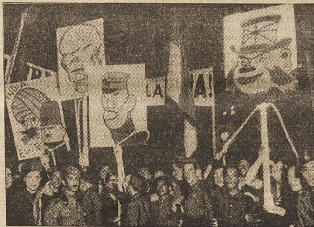
Italijanske demonstracije proti Angliji in Japonski

Ameriški vojni invalidi so se ponovno napotili v Washington, da izvojujejo svoje pravice.