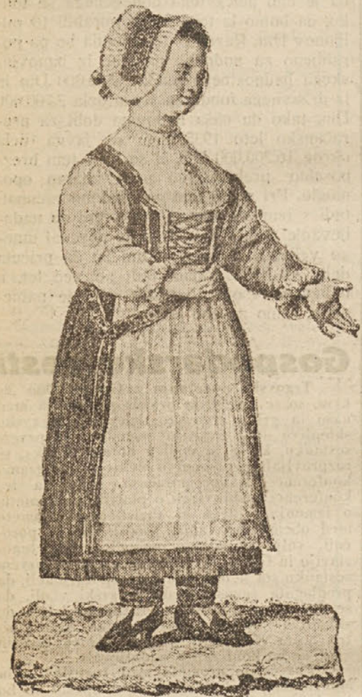
Najstarejša slika Gorenjke, ki je izšla v Herrmannovi knjigi in jo je leta 1780. zanjo narisal ljubljanski slikar Herrlein.

S časom so se naše narodne noše tako izpremenile in pokvarile, da jih bomo morali podvreči najstrožji korekturi. Iz neznanja so ženske same ustvarjale noše, ki pristinim niti od daleč niso več podobne, na drugi strani so jih pa prav zelo pokvarile tudi razne nepoučene šivilje in vezilje. Na prireditvah vidimo že take noše, da jih lahko brez pomisleka imenujemo maskare. Zato moramo poiskati vire iz časov, ko je bila narodna noša pri nas še v vsakdanji rabi, in po njih kopirati, kar napravimo novega. Kakor smo nekdaj očistili jezik, tako bomo morali postopati tudi pri nošah, da iz najrazličnejše navlake in fantastičnih potvorb spet izluščimo to častitljivo dedščino v vsej pristnosti in značilnosti. Sicer imamo že v Valvasorju opisane naše noše in