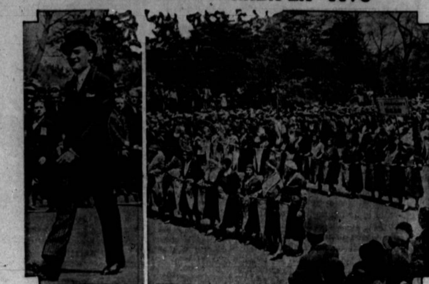
Na levi na tej sliki je newyorški župan "gigerle" Jimmy Walker, ki je nedavno vodil veliko manifestacijo v prilog "dobrega piva". Pravijo, da je take pijače v New Yorku zdaj nič koliko, ampak Jimmy potrebuje take parade, da slepi volilce. Ne le moški, tudi velika množica žensk je bila v paradi "za pivo", kot vidite sami.