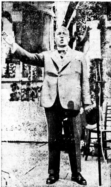
Minister g. dr. Anton Korošec na dekliskem taboru na Brezjah.

Odborniki so z velikim navdušenjem sprejeli predlog ter burno vzklikali dr. Korošcu. Obenem pa so pooblastili g. župana, da g. ministra obvesti o sklepu občinskega odbora in ga naprosi, da sprejme častno občanstvo kot izraz hvaležnosti in globokega spoštovanja mesta Kranja.