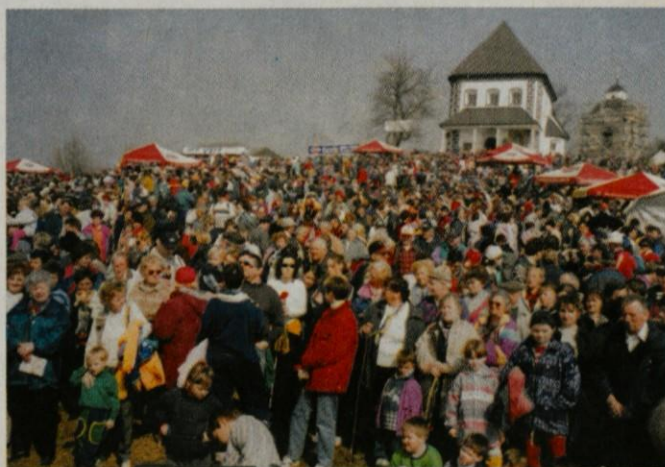
FOTO: Arhivski posnetek s 11. prireditve Po nagelj

Prireditve je tako poznana in priljubljena, da je ravno zaradi obiskovalcev nikakor ne kaže opustiti, saj nekateri že vso zimo čakajo nanjo. V času, ko se začenja narava prebujati, si ljudje, naveličani dolge zime, mraza in zaprtih prostorov, zaželijo nekam, kjer se lahko sprostijo, naužijejo čistega zraka, uživajo ob glasbi, domačih dobrotah, v lepem razgledu in se poveselejo ter tako nekaj naredijo za svoje zdravje in dobre počutje. Boste med tisočglavo množico letos, znova ali prvič, tudi vi?