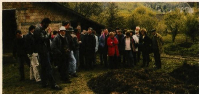
Ogled kompostiranja na kmetiji TURINEK v Jareninskem dolu

Utrinek s strokovne ekskurzije ob zaključku SEMINARJA O EKOLOŠKEM KMETOVANJU v preteklem letu.