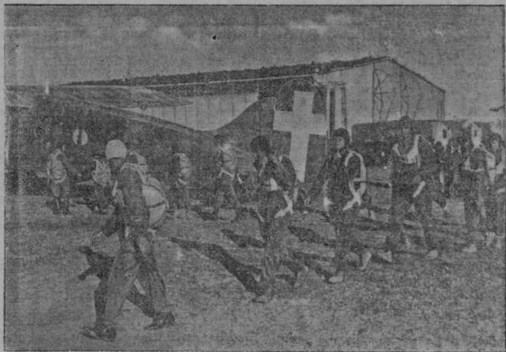
Italijanski padalci hitijo proti letalom, ki jih bodo odpeljala na bojišče