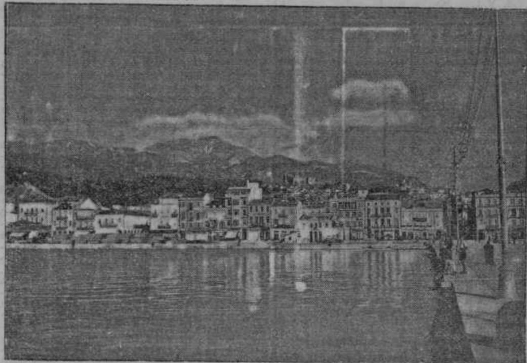
Grško pristanišče Patras so Italijani te dni hudo bombardirali iz zraka

vrsto rastline, ki raste ob vodah in jo imenujejo kendir. Ta rastlina raste v glavnem v kavkaškem ozemlju. Analiza je dooznala, da bi mogla ta rastlina dajati 16 odst. kavčuka. Če se bodo poskusi posrečili, bo Rusija v bodočnosti tudi kavčuk lahko pridobivala doma in se bo osvobodila od uvoza tega predmeta iz prekomorskih dežel.