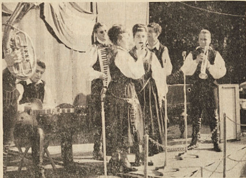
Nastop ene izmed kulturno-umetniških skupin iz Slovenije

Vsekakor pa moramo poudariti, da je mladinsko srečanje na Opčinah rodilo zelo pozitivne sadove, saj je, med drugim, pokazalo, da je možno najširše sodelovanje, ne gle-