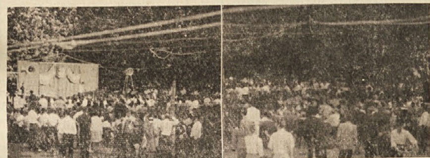
Mednarodnega srečanja mladine, ki je bilo v dneh od 27. do 29. junija na Opčinah se je udeležila velika množica

Grška demokracija, ki se je razvila po porazu fašističnega režima Karamanlisa, se po prihodu zmernega Papandreua na oblast še dalje krepi in razvija. Politični jetniki, ki so bili dolga leta zaprti ali konfinirani, se vračajo na svoje domove, med svoje ljudstvo. Vzpostavljajo se demokratične svoboščine, ki jih je prejšnja fašistična klika poteptala.