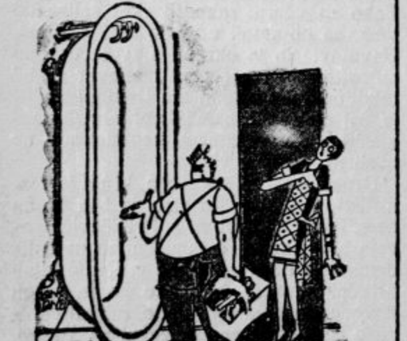
Ker je kopalnica premajhna, sem mogel postaviti kad (banjo) samo za prebilo.

Společke je prevladovalo mnenje, da je vionil Rupp v samostan, da ukrade razne dragocenosti. Tekom preiskave pa se je izkazalo, da je dovedla Rupa do teza, da se je utihotali v samostan, ljubezen do neke mlade nune, ki jo je spoznal na bregenskem kolodvoru, kamor se je vozila nakupovat živila. Zatrjuje se, da ni mlada nuna ničesar vedela, da se je Rupp že na prvi pogled do blaznosti zaljubil vanjo.