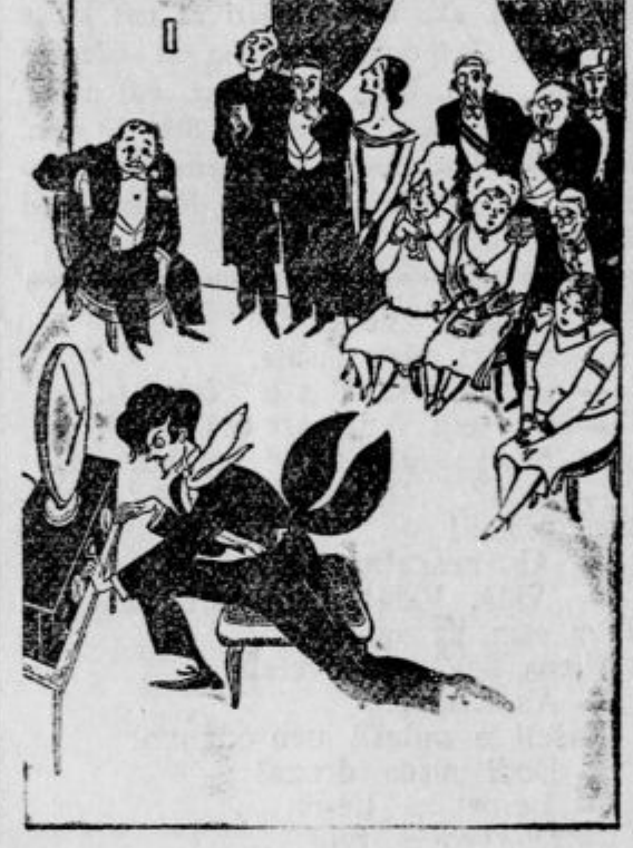
V stoletju radija Mojster koncertira. («Life»)

Moštva so se plasirala nastopno: 1. Hašk 15 točk, 2. Gradjanski 22, 3. Marathon 25, 4. Ilirija 30, 5. Concordia.