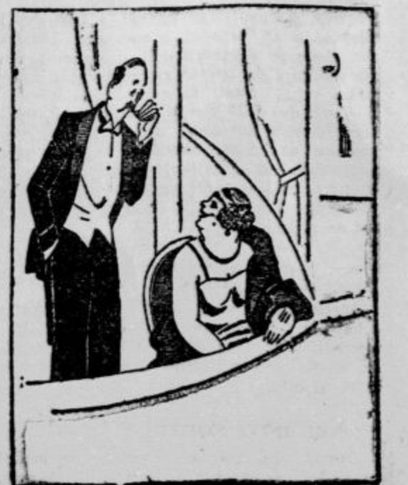
On: Grdi možje imajo običajno najlepše žene. Ona: Dobro se znaš prilagovati!

bo imelo v soboto 31. t. m. ob 4. uri popoldne svoj redni občni zbor na III. državni gimnaziji (Beethovnova ulica). Dnevni red: a) Poročila odbornikov in b) volitev novega odbora. c) predlog in razgovor o nadaljnjem tisku Wiesthalerjevega latinsko slovenskega slovarja; c) slučajnosti. Zaradi pod c) omenjenega prevajnega predloga prosi odbor čim večje udeležbe.