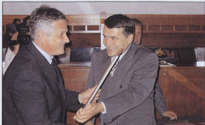
Kljub temu da še ni (zaradu gradnje) urejena tudi širša okolica Doma starejših občanov v Medvodah smo lahko veseli urejenosti samega objekta zunaj in znotraj ter prizadevanja vseh zaposlenih in nam je zato lahko v ponos.