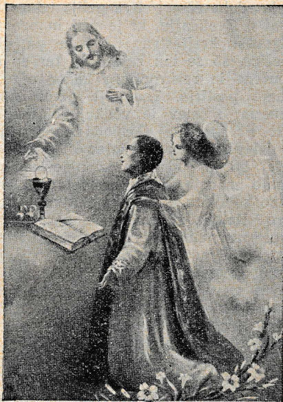
Gospod, daj nam dobrih duhovnikov!

Moli torej in žrtvuj se za svoje duhovnike!