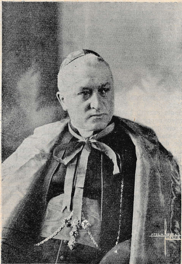
Nj. Em. kardinala dr. Avgusta Hlonda, primasa Poljske, je papež imenoval za svojega odposlanca na II. jugoslovanskem euharističnem kongresu.

2. Kristusova cerkev je kvas med narodi. Polagoma pa vztrajno deluje in preobraža narode. Ima pa Cerkev dosti sovražnikov,