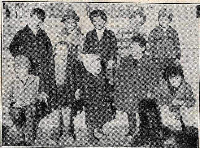
Najmanjši iz našega oratorija na Rakovniku.

Mladinski dom na Kodeljevem se redkokrat oglasi v Salezijanskem Vestniku. Tam se dela mnogo, a tiho. Malo je salezijanskih zavodov, kjer bi bilo toliko katoliških organizacij kakor v Mladinskem domu. V zadnjem času se je začelo posebno živahno delovanje za salezijansko sodelništvo. Razdelilo se je na tri oddelke: sodelništvo mož, sodelništvo fantov in sodelništvo žen in deklet. Vsak oddelek ima svojega predsednika, podpredsednika in odbornike. Namen sodelništva je katoliško življenje v Mostah, zato se skuša pritegniti vse, kar je katoliško mislečega, — je nekaka katoliška akcija. Da se ohrani navdušenje za delovanje, sta se odločila za moške vsak mesec po dva skupna se-