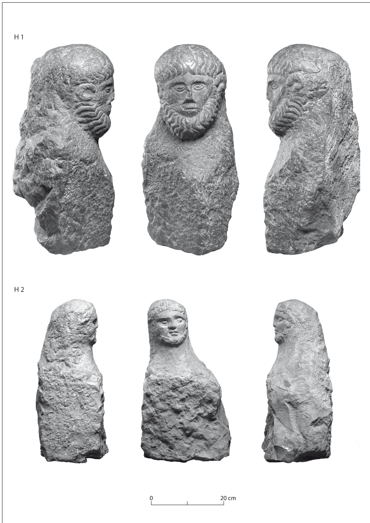
Sl. 1: Emonski hermi (H) 1 in 2 (Narodni muzej Slovenije); pomanjšano. Fig. 1: Herms (H) 1 and 2 from Emona; reduced size.