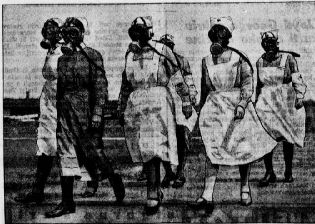
V Nemčiji se vrše tudi vaje bolničark Rdečega križa, ki opravljajo svojo službo pa »bojišče« s protiplinskimi zaščitnimi maskami.