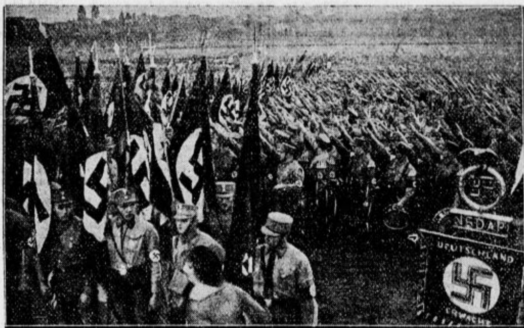
Slika z nekega zborovanja Hitlerjevih naskakovalnih bojnih oddelkov v Nemčiji. Kakor znano, je bil kancler Brüning te oddelke, ki ogrožajo Nemčijo z državljansko vojno, prepovedal, toda nova nacionalistično-aristokratska vlada von Pappena jih namerava v kratkem zopet dovoliti, nadejajoč se, da bo tako pripomogla k zmagi fašizma v Nemčiji.

Pokojniku naj bo zemljica lahka. Preostale pa naj tolaži Bog!