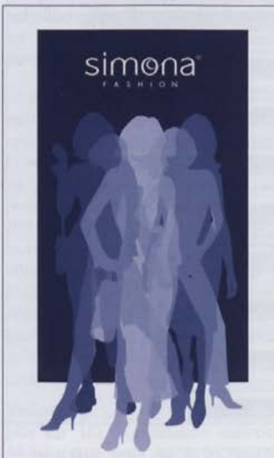
Silhuete bodo nosilni motiv komunikacije nove podobe Simone Fashion

Na nejavnem anonimnem natečaju je bil med petimi prispelimi predlogi izbran posodobljen logotip. Strokovna komisija je ocenila, da njegov karakter najbolj ustreza sporočilnosti in pozicioniranju blagovne znamke Simona Fashion, ki ponuja udobno