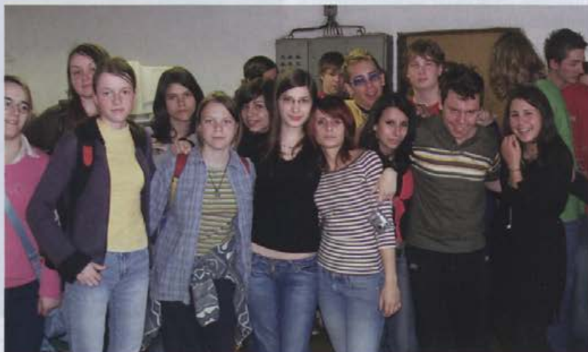
Mariborski gimnazijci na obisku Alpine

Proizvodnjo v Alpini si je ogledalo skoraj sto gimnazijcev iz Maribora. Na strokovni ekskurziji so obiskali Škofjo Loko, Rakov Škocjan, Cerkniško jezero in Planinsko polje. Seveda so se ustavili tudi v Žireh in si ogledali, kako nastane čevljev. Razdelili so se v tri manjše skupine, da so jim Alpinini strokovnjaki lažje obrazložili in razkazali proizvodnjo obutve. Spoznali so različne faze izdelave čevlja. Ogledali so si sekalnico, prirojevalnico in šivalnico, kjer se prične in konča zgornji del športne in modne obutve. Nato so se odpravili v lahko montažo (dokončanje modne obutve), športno montažo in v delavnico brizgane obutve. Spoznali so se tudi z izdelavo alpske obutve, kjer je potrebno najprej izdelati orodja, ki omogočajo vlivanje plastike. Gimnazijci so bili nad vodenim ogledom navdušeni. Med pogovorom so mi zaupali nekaj svojih ugotovitev z ogleda. Niso si predstavljali, da je