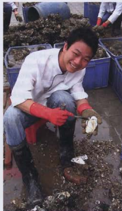
Čistilec ostrig na Kitajskem