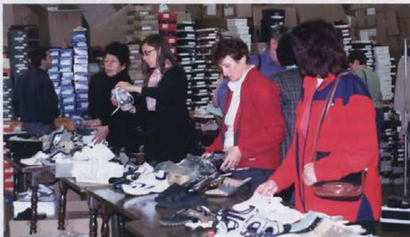
Kupci izbirajo obutve v DD Partizan