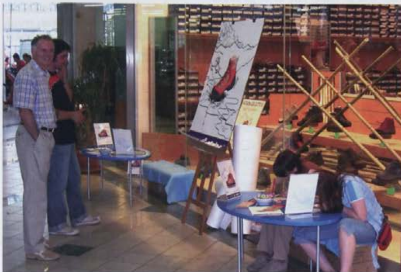
Otroci so ustvarjali skupaj z Alpino

Tudi na najmlajše nismo pozabili. Zanje smo pripravili nagradno igro: »Nariši svoj Cristallo«, v okviru katere so imeli možnost in priložnost narisati svojo karikaturu čevlja. Vneto so ustvarjali pred prodajalno. Nekateri izmed njih so se povsem prepustili domišljiji in nastalo je kar nekaj odličnih slik. Najboljše izmed njih so bile tudi nagrajene.