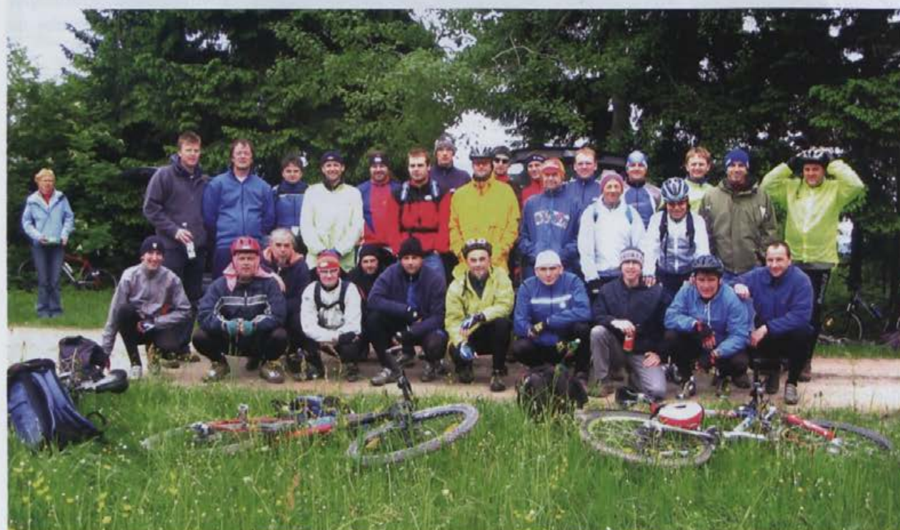
Udeleženci letošnjega Bajk partija