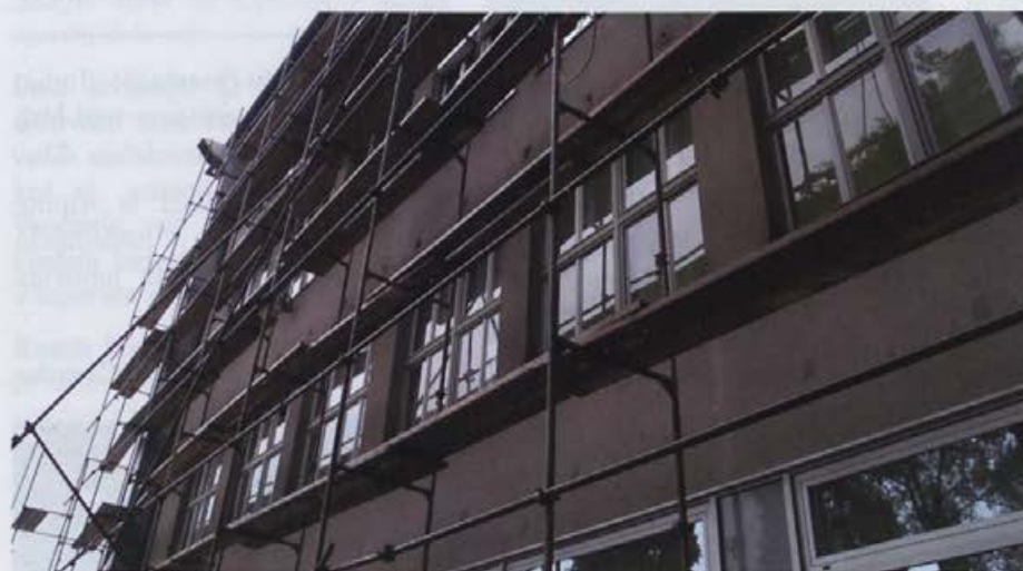
Upravna stavba bo dobila novo podobo