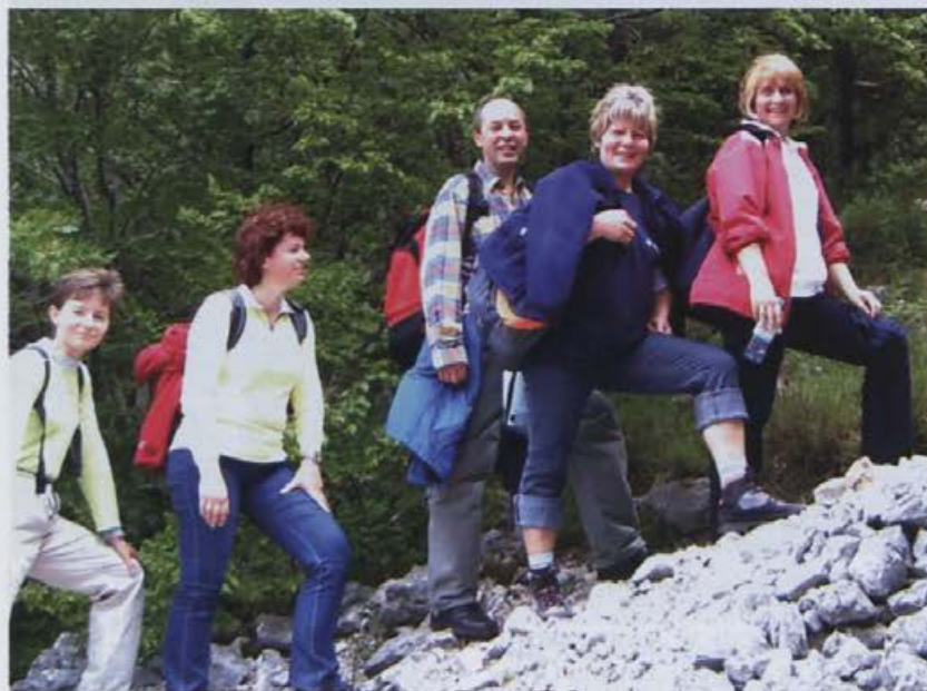
Udeleženci pohoda na Otliški Vrh

V soboto, tretjega junija so se na tradicionalnem srečanju zbrali delavci tekstilne in usnjarsko predelovalne industrije. V Ajdovščini so potekale športne igre in pohod v okolici. Srečanja se je udeležilo osemdeset Alpinskih delavcev. Skupine so tekmovalale v malem nogometu in namiznem tenisu. Sicer niso osvojili medalje, a v skupnem duhu trdijo: »Pomembno je sodelovati, ne zmagati.« Številni udeleženci srečanja, med drugimi tudi sodelavci iz Alpine, so se udeležili pohoda na Otliško okno. Med potjo jim je vodič podrobneje obrazložil okoliško pokrajino ajdovske doline. V Ajdovščini so si ogledali mestno jedro in okolico z izvirov Hublja.