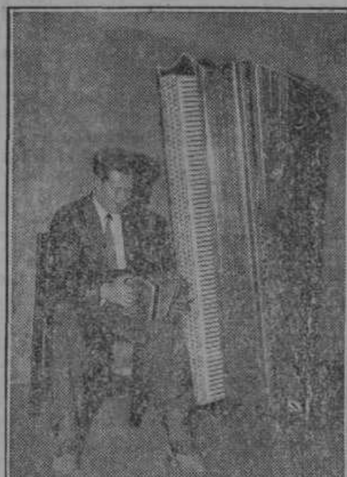
Največja harmonika tehta 80 kg — najmanjša 1300 gramov.

Najnovejša ugotovitev prebivalstva v naši državi. Na dan zedinjenja, to je 1. decembra 1918 so cenili število prebivalstva v naši državi na 11.621.026. Pri prvem ljudskem štetju dne 31. januarja 1921 jih je bilo 11.984.911 in je do prihodnjega štetja dne 31. marca 1931 naraslo število za skoro 2.000.000 ljudi na