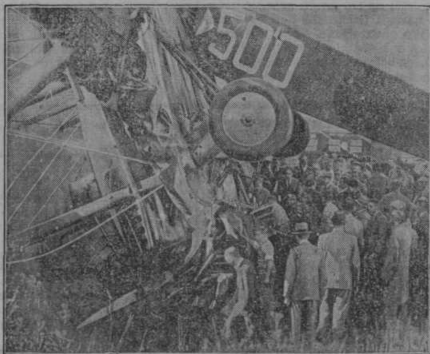
Med dirko v Brooklandu na Angleškem je strmoglavilo na tla in se razbilo težko borbeno letalo.

Skrivnostni studenec. Spisal Pavel Keller, poslovenil dr. Ivan Dornik. 70. zvezek Cirilove knjižnice. Dobi se v tiskarni sv. Cirila v Mariboru. Cena: broširano Din 16.—, vezano Din 26.—.