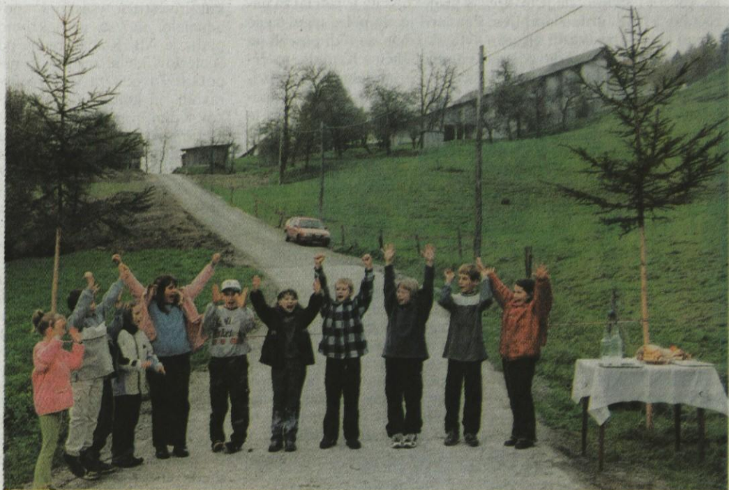
Pristno in zavzeto medsebojno sodelovanje domačinov še vedno živi. V to smo se prepričali na obisku pri prijaznih ljudeh zaselka nad Motniško Belo, ki so prispevali mnogo lastnega dela in finančnih sredstev, da je ob pomoči Občine Kamnik in krajevne skupnosti Motnik cestna povezava iz Motnika do domačije Planinc dobila svojo končno podobo in asfaltno prevleko. Pomembne pridobitve se je v petek, 26. oktobra, veselilo tudi vseh enajst osnovnošolcev iz Motnika, ki so ob tej priložnosti pripravili prisrčen program.