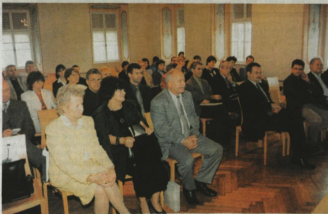
V grajskem salonu na Zapricah so župani z ministrico Rihterjevo temeljito pretresli pereča vprašanja s področja kulture in ugotovili, da bodo poleg države morali tudi v občinah še marsikaj storiti za njihovo reševanje.