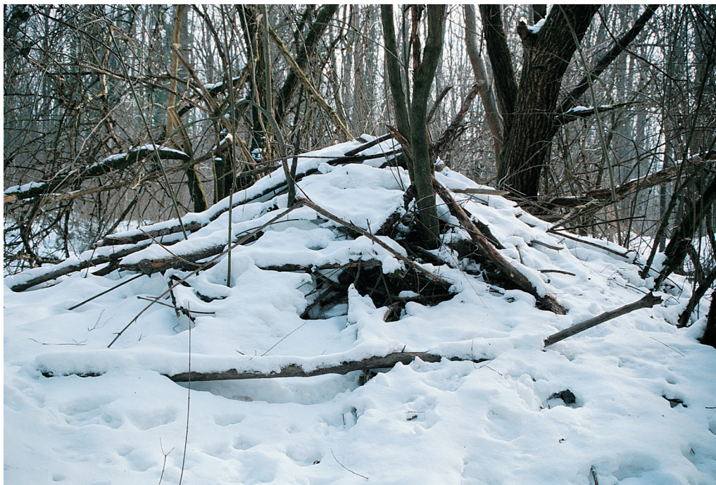
Slika 3 Veliko bobrišče na območju Žutice.