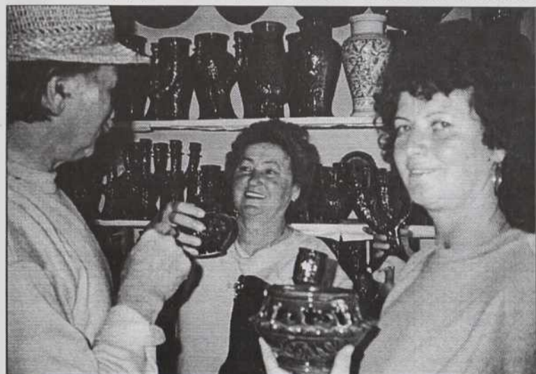
V vasi Korond vsi živijo od starih obrti. Za njihovo keramiko sta najbolj značilni modra in zelena barva.

Na koncu še nekaj o bivanju v romantičnem penzionu "Sikaszó". Pred odhodom smo dobili informacije, da bomo bivali po evropskih razmerah, torej bo na razpolago elektrika, topla voda. Ker pa je penzion nekaj kilometrov od vasi ter na tistem območju še ni električne napeljave, je za elektriko skrbel agregat, ki je dan po našem prihodu "odpovedal". Nič hudega, kako romantične so večerje pri svečah! (Če si ponoči iskal kakšne stranske prostore, več ni bilo toliko romantike.) Še nekaj smo se naučili. To namreč, da ne smemo biti sebični pri tuširanju. Če si se dolgo tuširal, se je lahko zgodilo, da so tvoji sopotniki ostali brez (tope) vode. Naslednji dan se je to lahko pripetilo tebi. Zelo hitro smo se naučili, kako "šparati" z vodo, ki so jo črpali iz bližnjega potoka. Za "odškod-