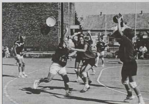
Monošter, 14-16. avgusta. Rokometna turnirja za Pokal mesta Monošter se je udeležilo približno 15 ekip, med njimi tudi ekipe iz Crenšovec.