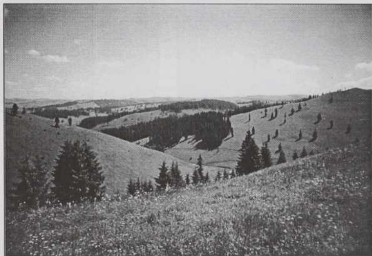
V dolinah hribouja Gyimes se skrivajo, kot biseri, vasi Čangojev.

čiščenja. Termalna kopališča v tej pokrajini so bila priznana in priljubljena tudi v času Avstro-Ogrske monarhije. Ko se človek sprehaja po ulicah mesteca Parádfürdő, si lahko predstavlja, kakšno je bilo življenje aristokracije Monarhije na prelomu stoletja. Široka promenada, mogočne