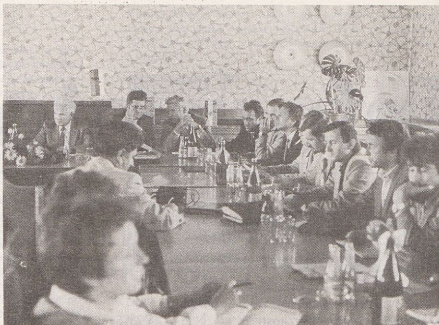
Na pogovoru smo slišali kopico obetavnih pobud in napotkov, kako naprej do začrtanih ciljev.