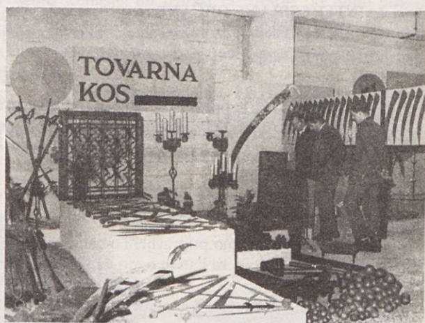
Posnetek z razstave

Na odgovornih delovnih mestih so delali tujci, različka v plačah pa je bila tudi 10-kratna. Domači delavec je lahko le garal, toda zapihal je drugi veter, po-metal je s tujci in njih sodrgo. Napočilo je novo jutro, zakon o upravljanju podjetij je dal delavcu pravi-co, da sam odloča o rezultatih svojega dela.