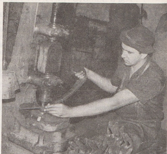
Izgotavljanje kose v TOZD 05 Lovrenc na Pohorju

Od obrata s 70 zaposlenimi smo postali kolektiv, ki je 5 krat večji od takratnega. Namesto kladiv nam pojejo zračna kladiva, godrnja valjarski stroj in ob praznovanju si želimo, da bi dostojno nadaljevali delo naših prednikov. Ne bojimo se dela, toda želimo si boljših delovnih uspehov in smo ravno zaradi tega združili delo in sredstva z delavci GORENJA – Mute.