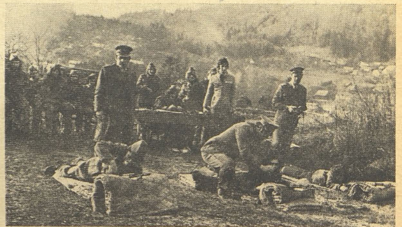
Večkrat je še potrebna strokovna pomoč

drugim tudi povprečna ocena odlično pri streljanju z vojaško puško. Tudi od idejnopolitičnega izobraževanja so mladi prostovoljci precej odnesli.