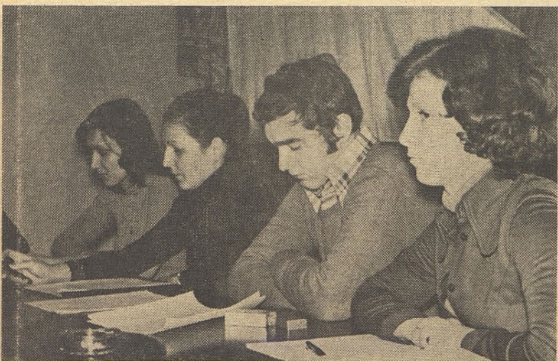
Mladinci so plodno sodelovali na ustanovni seji OO ZSMS javnih delavcev