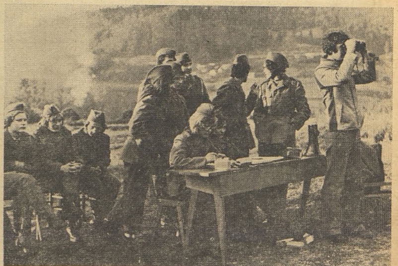
V pričakovanju rezultatov