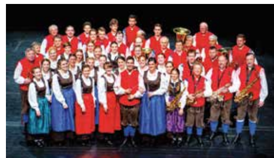
Pihalni orkester Jesenice – Kranjska Gora