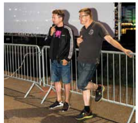
Film Pr'Hostar je bil na ogled tudi v letnem kinu na Jezerski promenadi