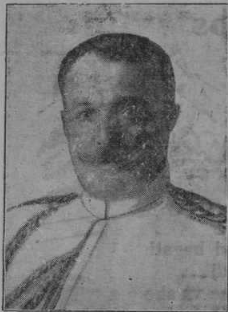
Umrlí bivši vojni minister general Štefan Hadžič.

silci so storili svojo dolžnost in zavarovali sosedna poslopja in preprečili popolno nesrečo. Zgorelo je 5 posestnikom 12 gospodarskih poslopij z vso opremo, nekaj svinj in precej perutnine. Zavarovan je bil le eden in še ta za malenkost 1000 Din. Požar je zanetila deca, ki se je igrala z užigalicami.