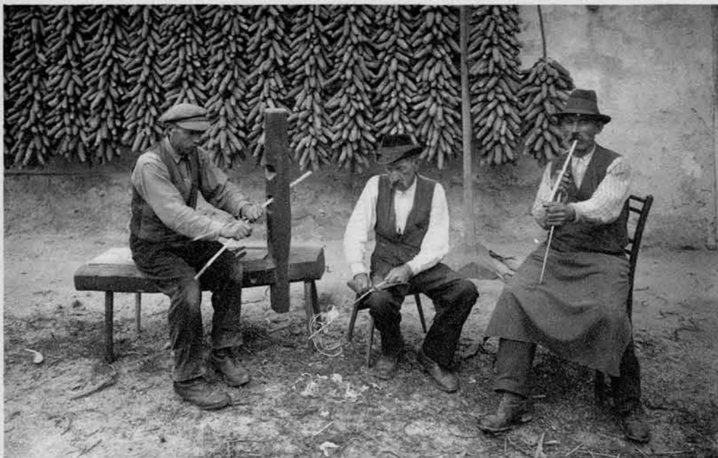
Začetek rešeta — Od leve na desno: prvi kolje vitre na stolu v babi, drugi strže vitre, tretji jih pa dere in cepi z zobmi.