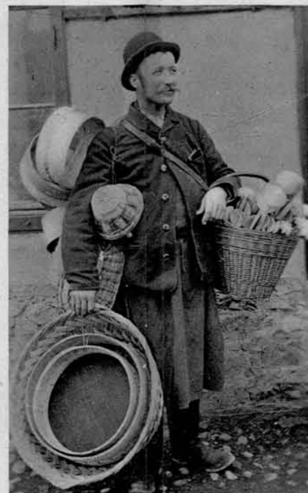
S suho robo po svetu.