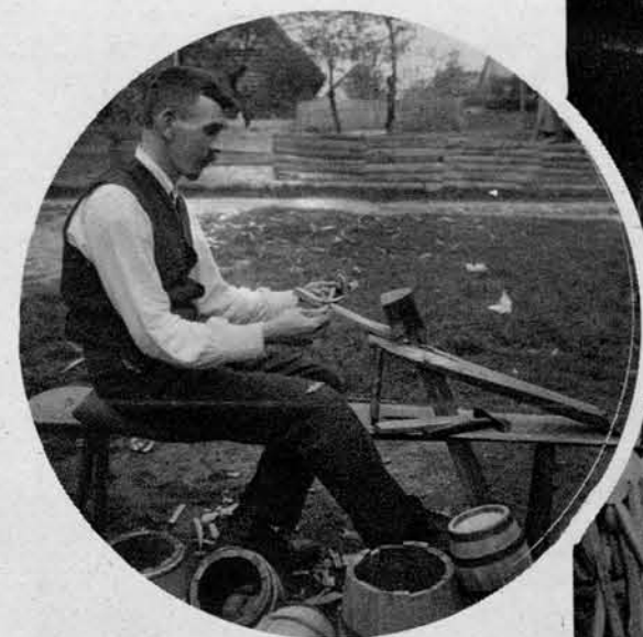
Sodar obrezuje doge za sodčke .