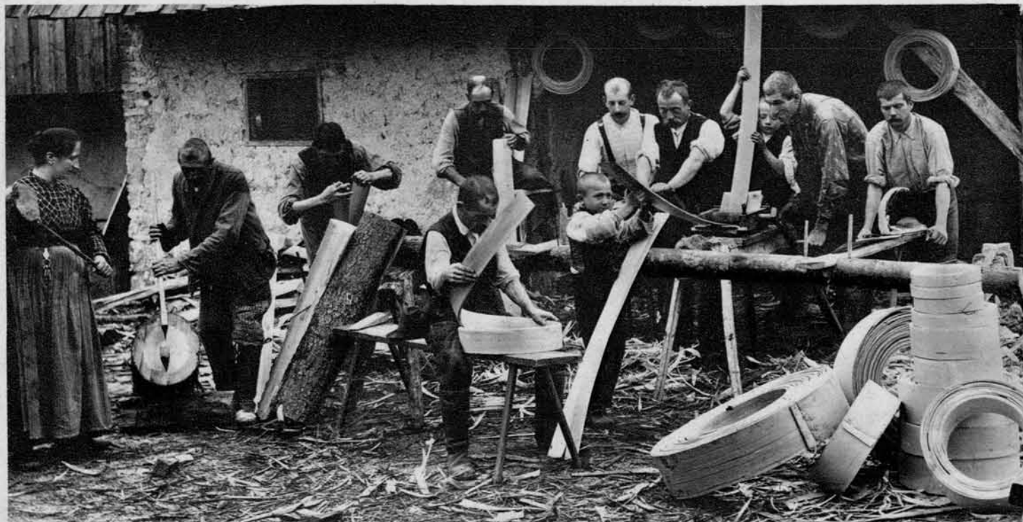
Obodarji pri delu — Od leve proti desni: Prvi kolje smrekov hlood, naslednji cepi »četrti«, nadaljnji pa stružejo, krivijo in potakajo obode.