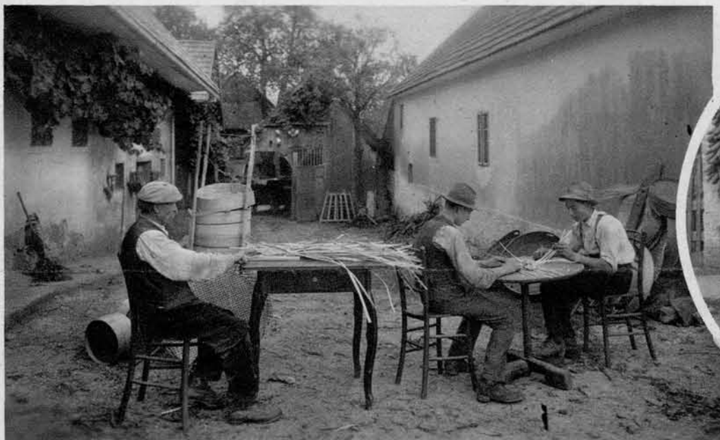
Levi rešetar »devlje vitre v rezar«, da so vse enako široke, desna dva pa pleteta dno reše.

Naša suha roba je poznana daleč preko slovenskih meja prav do Karpatov, čeških obmejnih pogorij, daleč doli v Italijo in na Balkan. Njena domovina je predvsem Ribniška dolina, zlasti vasi Breže, Jurjevica, Gorenja vas, Kot, Slatnik, Breg, Sajevec, Dane, Bukovca in vasi župnije Sodražice. V občinah Gora in Loški potok izdelujejo predvsem ribežne, nekatere sosedne vasi le obode, nekatere druge pa le škafe in zobotrebece. V večji ali manjši meri se pečata z eno ali drugo vrsto suhe robe ves ribniški in gornji del velikolaškega sodnega okraja. Ta panoga domače obrti je v teh krajih jako stara, saj so ob prevratu n. pr. zahtevali pravice, ki so jih imeli že od »časov Marije Terezije«. — Krošnjarji zahajajo navadno vse svoje življenje v iste kraje, in to prehaja od očeta na sina. To jim je tem lažje, ker so povsod znani in cenjeni kot jako pošteni, skromni in miroljubni ljudje.