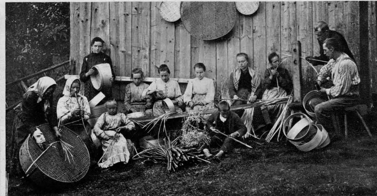
Družina ribniškega rešetarja pri delu — Od desne na levo: gospodar cepi vitre, dekleta poleg njega jih dere z zobmi, naslednji dve jih čistita, nadaljnje šivajo dna v obode, sprednja dva otroka pa stržeta palice za vitre.