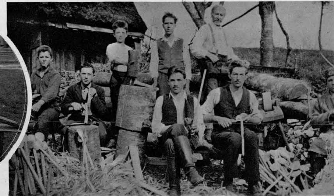
Rodbina z Novega pota pri Sodražici izrezuje kušalnice in žlice .