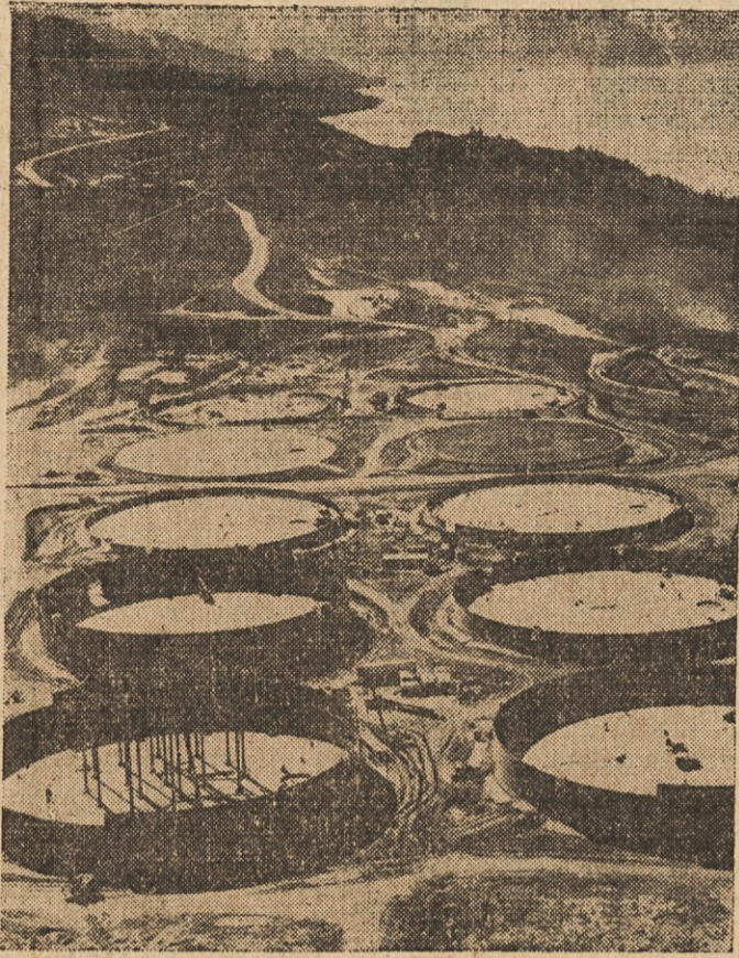
DA BODO NA RAZPOLAGO — V Valdezu na južni obali Aljaske gradijo velikanske tanke, v katere bodo spravljali olje, ki bo pritakalo po vodu iz nahajališč ob Prudhoe zalivu na severu.