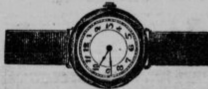
Zapestne ure, srebrne od Din 152.— naprej. 14 karat zlato od Din 296.— naprej.

PREŠERNOVA ULICA 4 — POLEG FRANCISKANSKE CERKVE — NAJVEČJA ZALOGA UR, ZLATNINE IN SREBRNINE. — LASTNA TOVARNA UR V SVICI