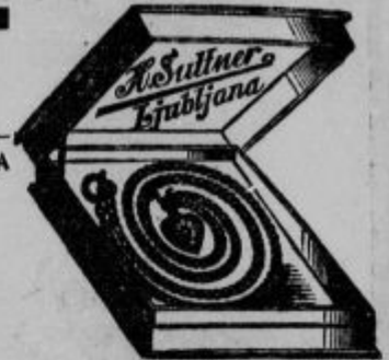
Srebrne vrtnice (Collier) od Din 20.— naprej Zlate vrtnice (Collier) od Din 85.— naprej