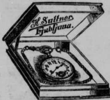
Ure za dečke od Din 44.— naprej.